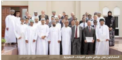
المشاركون في برنامج تطوير القيادات التنفيذية

العمالية وتعزيز قدراتهم وصلح مهاراتهم أكبر وأكثر في مستويهم العملي" وعبر أحد المشاركين في البرنامج عن مسعاده بهذه الخطوة التي تأتي في إطار حرص المؤسسة على تطبيق أحدث الأساليب العالمية في مجال الإدارة وأضاف: استفدنا معرفة كيفية تعزيز العمل الجماعي في المؤسسة وتعزيز التواصل مع الموظفين، وتنمى أن تقوم بتطبيق كل ما تعلمناه خلال هذه المرحلة في مؤسستنا من أجل تطويرها وللمساهمة في بناء الوطن.