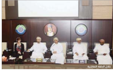
ممثل الحلقة النقاشية