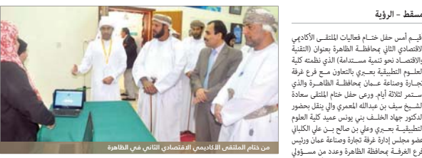
ممن ختم الملتقى الأكاديمي الاقتصادي الثاني في الظاهرة