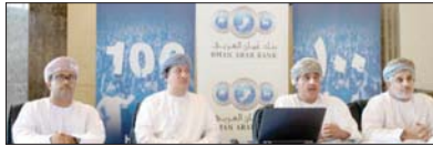
أهداف البرنامج الذي تم تصميمه لمضاعفة فرص الفوز

عشرات الفائزين بجوائز بقيمة 500 ريال عماني من خلال مكافأة 100 فائز شهرياً لهذا العام. وأضاف الشريعة الكري للمنطقة بقيمة 25 ألف ريال عماني، أما عن شروط الدخول في سحبات برنامج مسقط للفئة، فما على الزبائن إلا الاحتفاظ بملف 100 ريال على الأقل في حساباتهم ليتمكنوا من الدخول في سحبات البرنامج كما سيوقع البنك بإجراء سحبات خاصة لحسابات الأطفال بجائزة 250 ريال عماني لعشرة فائزين في كل شهر، وستعقد عملاً "ليلت" من البرنامج الجديد لسحوبات جوائز صحراء حيث سيكون بإمكانهم الآن أن يشاركوا في السحوبات الشهرية المخصصة على جائزة 25000 ريال عماني شهرياً، بالإضافة إلى سحبات جوائز نصف الصغار ونهاية العام بقيمة 50000 ريال عماني في يونيو وسبتمبر.