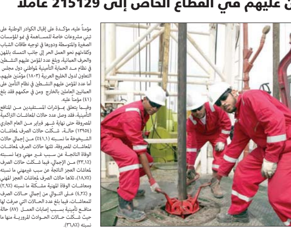
موظفون يعملون في موقع بناء