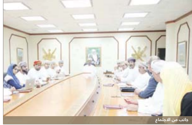
كاتب من الصناعات