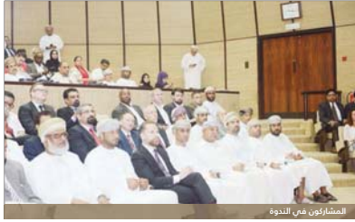
المشاورين من السلطنة