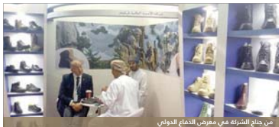
من جناح الشركة هي معرض الدفاع الدولي

شارك شركة الأخذية الواقية في معرض ومؤتمر الدفاع الدولي (إيدكس) في أبوظبي بالإمارات العربية المتحدة. والمنتج المعروض صاحب السمو محمد بن راشد آل مكتوم نائب رئيس الدولة وصاحب السمو الشيخ محمد بن زايد راعهم الله.