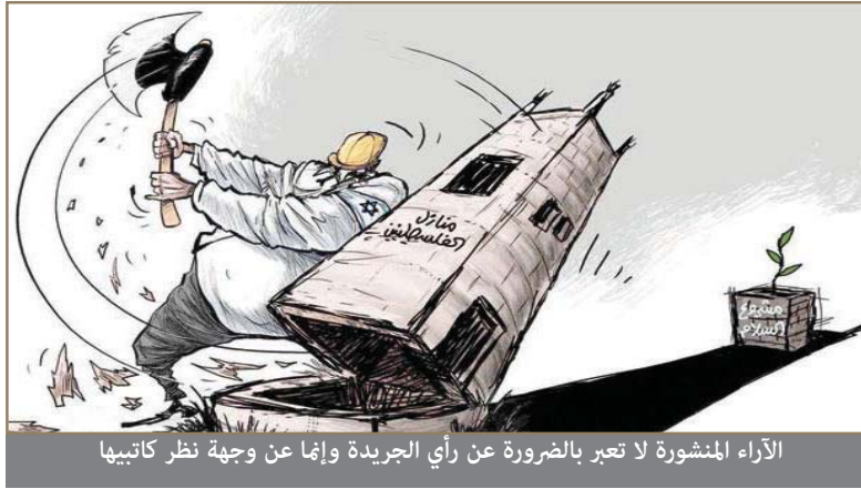
الأراء المنشورة لا تعبر بالضرورة عن رأي الجريدة وإنما عن وجهة نظر كاتبها