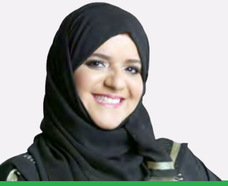
سعادة الإسماعيلية *

للألعاب.. فلم تعد هناك لعبة مقصورة على جنس واحد؛ فجميع الألعاب الأولمبية المعترف بها من قبل اللجنة الأولمبية الدولية باتت مفتوحة أمام الأبطال من الجنسين وبشكل متساوٍ.