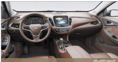
تصميم داخلي رائع

في البقاء على المسار لمساعدته في منع حوادث الانقلابية عند الدوران والاتصال بخدمات الطوارئ بالنسبة لعملائه، وتأتي شيفروليه ماليبو ٢٠١٧ مع نظام الاستشعار للوسائد الهوائية