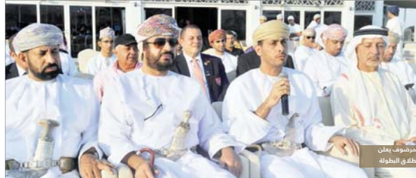
المشرفون على انطلاق البطولة

أكد معالي الشيخ سعد بن محمد بن سعيد المشرفون السعودي وزير الشؤون الرياضية أن استضافة البطولة العربية للجولف تعكس حرص السلطنة على الاهتمام بتتمية قدرات الفرد باعتبارها محور عملية التنمية الشاملة بفضل النهج الذي يتخذه صاحب الجلالة القائد المفدى السلطان قابوس بن سعيد - حفظه الله ورضاه - قائد مسبق الباء والتنمية التي تشهدها السلطنة، وفق رؤيته الثاقبة والتي ترجمها حكومتنا الرشيدة على أرض الواقع، وقال معاليه بعد افتتاح البطولة العربية للجولف في نسختها من ٣٦ التي تستضيفها السلطنة خلال الفترة من ٨ وحتى ١٣ من نوفمبر الجاري وذلك بتنادي غلا