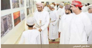
دولة في المعرض

المشاركات لتقييم لجان التحكيم المشكلة من الجمعية العمانية للتصوير الفوتوي، والجمعية العمانية للفنون التشكيلية. وبعد ذلك تم عرض فيلم مرئي عن جماليات الخط العربي وأهداف ومضامين مسابقة التصوير الفوتوي والخط العربي لطلبة مدارس محافظة الظاهرة.