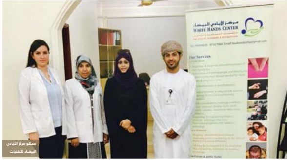
مسقط مركز الأيادي البيضاء للتقنيات المساعدة والتأهيل

قدم بنك مسقط المؤسسة المالية الرائدة بالمسقط الدعم لمركز الأيادي البيضاء للتقنيات المساعدة والتأهيل... المبادرة الوطنية «بصمات» تحت رعاية معالي الشيخ محمد بن سعيد الكلباني وزير التنمية