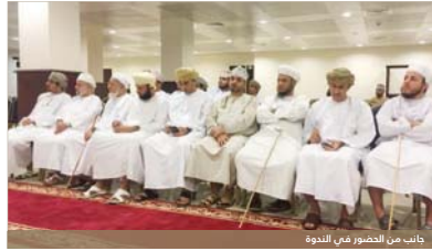
جانب من الحضور في الندوة

كشف ٤ من الباحثين العمانيين خصوصية وأهمية الموسوعات العمانية المعرفية في إثراء المكتبة العمانية وذلك في الندوة التي أقيمتها الجمعية العمانية للكتاب والأدباء، بمقرها برمفصات المطار، وقدمها الدكتور محمد بن حمد الشبيبي.