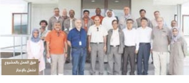
تحسين مصفاة صحر

حَقَّق مشروع تحسين مصفاة صحر إنجازاً جديداً باستكمال 40 مليون ساعة عمل دون وقوع أي إصابات... المبادرة الوطنية «بصمات» تحت رعاية معالي الشيخ محمد بن سعيد الكلباني وزير التنمية