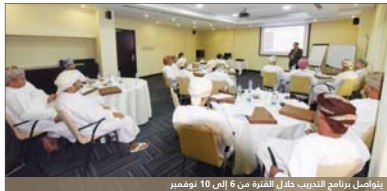
يتواصل برنامج التدريب خلال الفترة من 6 إلى 10 نوفمبر

المشروع وتقليل نسبة الأخطاء التي قد تحدث أثناء إدارة وتخطيط المشروع، ويهدف البرنامج إلى تدريب الموظفين على مهارات ومعايير إدارة المشاريع الاحترافية (PMP) للوظائف الإدارية والتخصصية خلال الفترة من 6 وحتى 10 نوفمبر الجاري، وذلك في إطار سعي الهيئة لتطوير مهارات موظفيها وجعلها منتمية في تنمية قدراتهم في إدارة المشاريع وخبراتها ولدى فهم أهداف الهيئة المستقبلية. ويأتي ذلك ضمن البرامج التدريبية المعدة مسبقاً لهذا الغرض حيث إن برامج إدارة المشاريع ومعايير المشروع ناجح ومعتبر أصبحت مطلباً مهماً لتحقيق أهداف