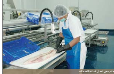
تخلت من أعمال تعبئة الأسماك

تحقيق الأمن الغذائي لا يبقى على أحد الاستغلال الموارد السمكية في التصنيع السمكي يساعده وجود منتجات محلية تغطي حاجة السوق المحلي بمختلف الأنواع، كما أن الفاضل منه سيوجه للتصدير الخارجي الذي لا يقتصر جانبه الإيجابي على المسور الاقتصادي الممثل في عائد مادي بل الجانب الثقافي حاضر أيضاً فالصناعات باليد المنتج في الخارج ميزة