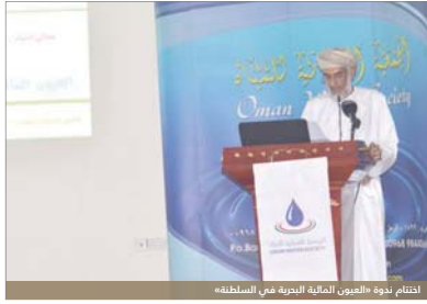
اختتام ندوة «العيون المائية البحرية في السلطنة»

وقد ناقشت الندوة على مدى يومين بمشاركة خبراء ومختصين في قطاع المياه من داخل وخارج السلطنة ١٩ ورقة علمية تناولت عددا من المحاور المهمة، تأثر العناصر البيولوجية والبيدرولوجية والبيئية في تكوين العيون البحرية والخصائص الفيزيائية والكيميائية لجسأه العيون البحرية والمواسلة