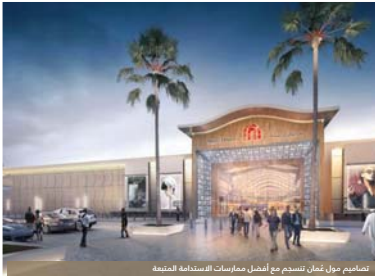
تتويج مول عُمان بتتويج من أفضل مشاريع الإنشاءات المتكاملة

اعلنت مجموعة «ماجد الفطيم» عن بدء أعمال تشييد «مول عُمان» الذي سيمتد للواجهة الأخرى... المبادرة الوطنية «بصمات» تحت رعاية معالي الشيخ محمد بن سعيد الكلباني وزير التنمية