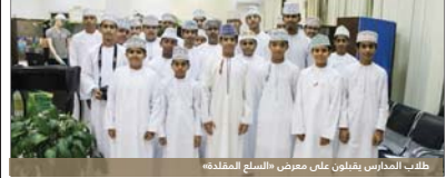
طلاب المدارس يقولون على «السلع المقلدة»