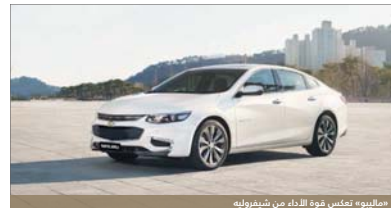
«ماليبو» تعكس قوة الأداء من شيفروليه

أعلنت مجموعة المؤسسة التجارية العمالية، الموزع الحصري لسيارات شيفروليه في السلطنة، عن توفير سيارات شيفروليه ماليبو الجديدة كلياً ٢٠١٧، والتي تأتي في حلة مغايرة تعيد تعريف الأسلوب والديناميكية للسيارات السيدان.