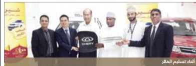
أثناء تسليم الجائزة