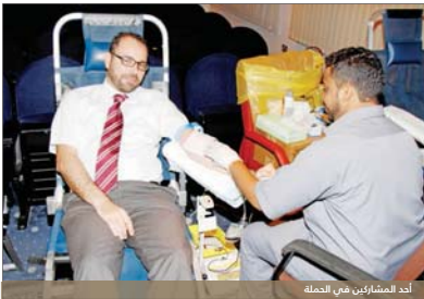
أحد المشاركين في الحملة