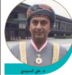
د. علي السنيدي

من جهته، أكد معالي الدكتور علي بن مسعود بن علي السنيدي، وزير التجارة والصناعة، نائب رئيس المجلس الأعلى للتخطيط «وسام الشمس المشرقة» - التهمة الذهبية الفضية من حكومة اليابان، تقديراً لإسهاماته في تعزيز العلاقات الاقتصادية والتفاهم المتبادل بين سلطنة عُمان واليابان، وذلك بالقصر الإمبراطوري بطوكيو. وقام بتقليد الوسام معاليه، دولة رئيس الوزراء الياباني شيزو آبي، بعد ذلك حظي معالي الدكتور والحاصلون على الأوسمة بمقابلة إمبراطور اليابان، وقد قدّم معاليه للحكومة اليابانية شكره وتقديره على هذه الفلحة الكريمة.