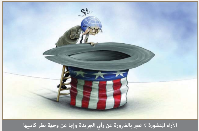
الآراء المنشورة لا تعبر بالضرورة عن رأي الجريدة وإنما عن وجهة نظر كاتبها

القطاع بجريحيين وكوادره مدربة على مستوى عال من المهارة. يعد ذلك جينا لشمار مجهودات كبيرة بذلت خلال السنوات الماضية، وتكريزا وعملا على تطوير هذا القطاع من أجل توفير كافة خدمات الرعاية الصحية الأساسية للمواطنين بالإضافة إلى المقيمين على أرض المملكة، والعكس ذلك على المؤثرات الصحية التي يمتصها أصبحت السلطنة تصنف ضمن الدول المتقدمة في مجال تقديم الخدمات الصحية على مستوى العالم، وذلك ضمن منظومة الرعاية الصحية بمستوياتها الثلاث، الرعاية الأولية التي تقدمها المراكز والمجمعات