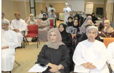
خاتم من الصور في حلقة العمل