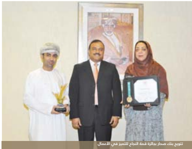
تتويج بنك صحر بجائزة الاتحاد العالمي للشركات الأمريكية

تُوِّج بنك صحر مؤخراً بجائزة الاتحاد العالمي لهذا العام وهي جائزة «قمة النجاح» للتصنيف في الأعمال... المبادرة الوطنية «بصمات» تحت رعاية معالي الشيخ محمد بن سعيد الكلباني وزير التنمية