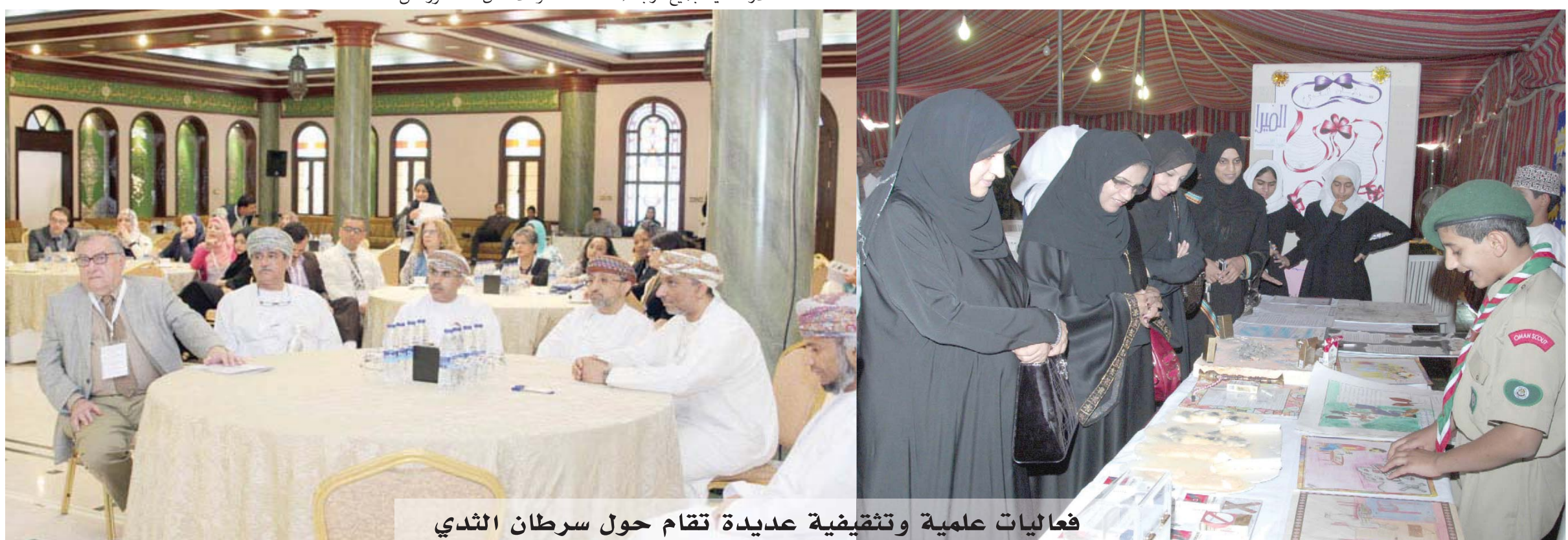
فعاليات علمية وتثقيفية عديدة تقام حول سرطان الثدي