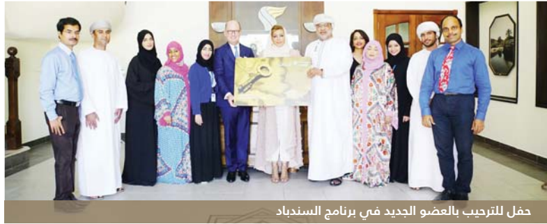
حفل للترحيب بالعضو الجديد في برنامج السندياد

تخفيضات على منتجات السوق الحرة والتي تعرض على متن الأجواء، فضلاً عن منحهم أولوية في تخليص إجراءات سفرهم إضافة إلى الحصول على أميال سندياد إضافية وغير ذلك الكثير. وعلق بول جريجورويتش، الرئيس التنفيذي للطيران العُماني: مسرورون بزيادة عدد