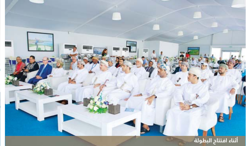
أثناء افتتاح البطولة