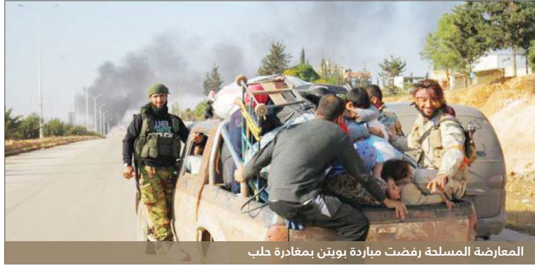
المعارضة المسلحة رفضت مبادرة بوتين بمغادرة حلب

الرئيس لا تعكس الواقع على الأرض. واتهم نائب قائد تجمع فاستقم، أحد أكبر الفصائل المقاتلة في حلب، ملحم العكيدي، الروس بالكذب، قائلًا إن "غارات الروس وجرائمهم مستمرة وطائراتهم لم تغادر سماء حلب". أما وزير الخارجية الروسي، سيرغي لافروف، فقلق في زيارة إلى اليونان، إن دولاً أخرى مشاركة في مفاوضات السلام "أفشلنا" المسار، بدعمها لجماعات متشددة تسعى لإسقاط الرئيس، بشار الأسد. وتقول روسيا وطلقاتها في سوريا إنهم أوقفوا الغارات الجوية يوم ١٨ أكتوبر. وتزعم حكومات غربية أن هذه الغارات تتسبب في مقتل أعداد كبيرة من المدنيين، ولكن روسيا تنفي ذلك. وسبق أن أعلنت روسيا والحكومة السورية عن هدنة إنسانية من أجل السماح للمدنيين والمسلحين بمغادرة المدينة، ولكنها العملية فشلت في تحقيق أهدافها، بسبب تواصل أعمال العنف من الطرفين وتبادل الاتهامات بمنع الناس من المغادرة.