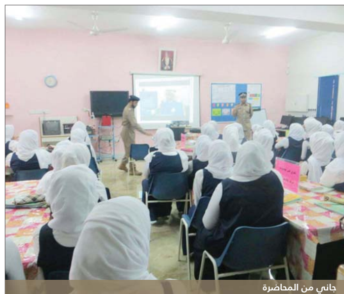
جاني من المحاضرة

تعاون المواطنين والمقيمين مع شرطة عُمان السلطانية في الإبلاغ عن الجرائم والكشف عنها، كذلك الحفاظ على مسرح الجريمة وطرق جمع الأدلة.