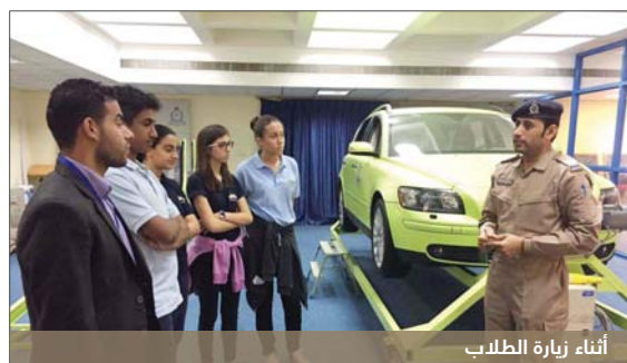
أثناء زيارة الطلاب