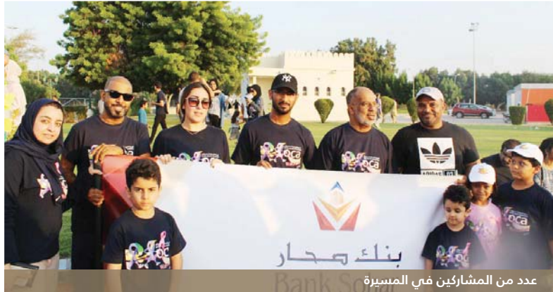
عدد من المشاركين في المسيرة

الدوري والكشف المبكر عن الإصابات. وبالإضافة إلى مشاركته في المسيرة، قام البنك في وقت سابق من العام الجاري بالتبرع إلى فرعي الجمعية في كل من محافظتي مسقط والداخلية، هذا التبرع الذي يُعد الثامن على التوالي الذي يقدمه البنك للجمعية العمانية للسرطان. وأصبحت أعمال المسؤولية الاجتماعية في صميم الاستراتيجية التشغيلية لبنك صحار؛ وتقديراً لهذه المساهمات، حصل البنك على مجموعة من الجوائز والإشادات المحلية والإقليمية والدولية كجائزة "درع التميز الذهبية للمسؤولية الاجتماعية من أكاديمية توتيز" بدولة الإمارات العربية المتحدة في عامي ٢٠١٤ و٢٠١٥، بالإضافة إلى جائزة "أفضل البنوك في مجال المسؤولية الاجتماعية في سلطنة عمان ٢٠١٤