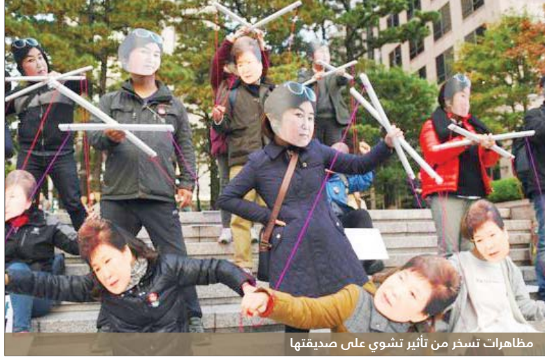
مظاهرات تنسخر من تأثير تشوي على صديقتها

رسمي وافقها إلى الخبرة واعتراض أجهزة الأمن على سلوكها، وفجرت فضيحة غضبا واسع النطاق. وفي صباح الثلاثاء اقتحم رجل في الخامسة والأربعين سيارة مكتب النيابة العامة في منطقة فيه سول، والتي يعتقد أن تشوي كانت فيه. وقال إنه "يريد مساعدة تشوي - سون - سيل على الموت"، وعُين ييم جونج - يونغ، رئيس لجنة الخدمات المالية الحالي، وزيرا للمالية ونائباً لرئيس الوزراء ليحل محل يو إي - هو. كما عُين كم يونغ - جون، وهو أحد كبار المساعدين الرئيسيين السابقين، رئيساً للوزراء ليحل محل هوانغ كيو - آهن. ويتسم منصب رئيس الوزراء بالرمزية إلى حد كبير بكوريا الجنوبية التي تركز السلطة فيها بيد مؤسسة الرئاسة. وشملت التغييرات أيضاً تعيين وزير جديد للسلامة والأمن العامين.