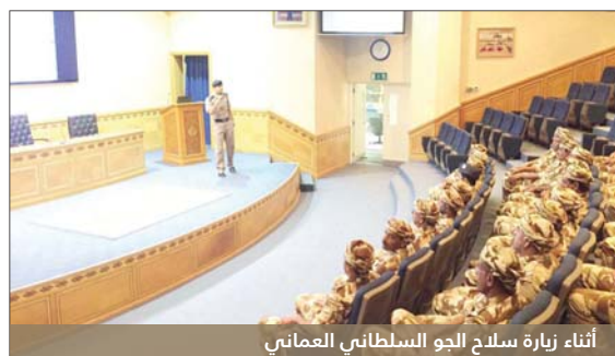
أثناء زيارة سلاح الجو السلطاني العماني