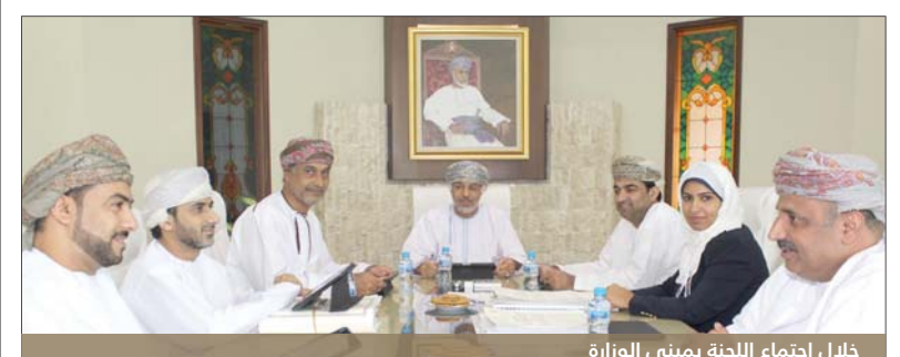
خلال اجتماع اللجنة بمبنى الوزارة