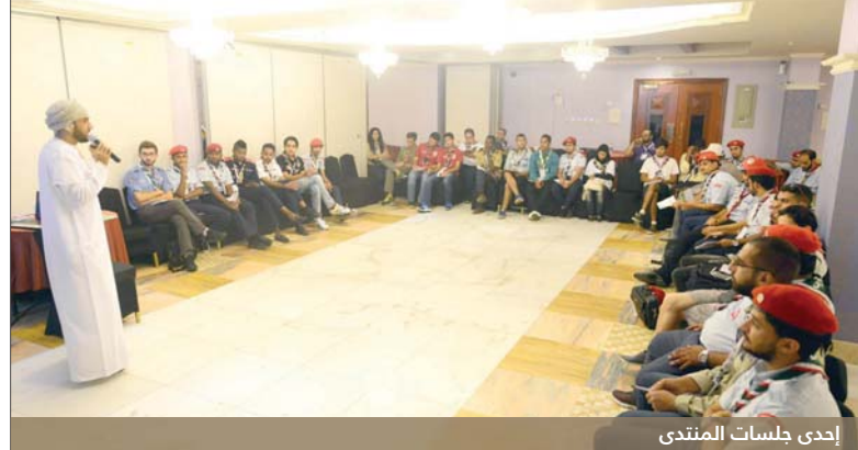
إحدى جلسات المنتدى