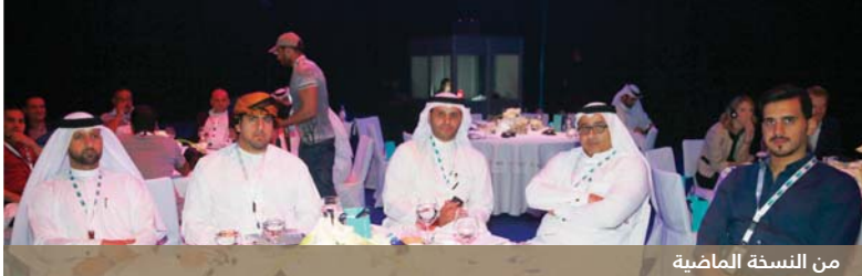
من النسخة الماضية

تستضيف السلطنة يومي الأحد والاثنين المقبلين الجولة التعريفية لمسابقة تحدي 22 والتي تأتي ضمن استعدادات دولة قطر لاستضافة مونديال كأس العالم لكرة القدم (قطر ٢٠٢٢) حيث يسعى مركز تواصل العالمية بالتعاون مع صندوق تنمية مشاريع الشباب وعمان المعرفة إلى تعريف الشباب العماني بالنسخة الثانية من (التحدي) وذلك بالتعاون مع اللجنة العليا للإثراء والمشاريع الجهة المسؤولة عن استضافة كأس العالم في ٢٠٢٢. سيتم استضافة ممثلي وسفراء المسابقة في السلطنة على مدار يومين، الأحد القادم في كلية