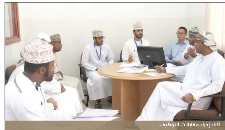
أثناء إجراء مقابلات التوظيف