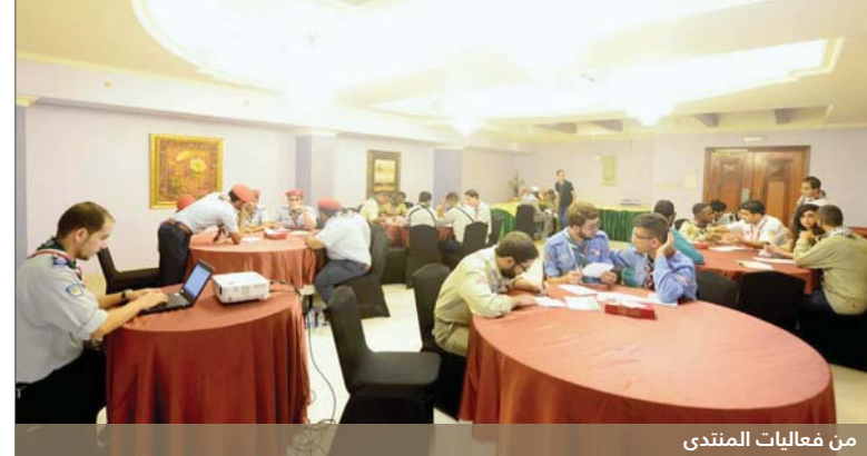
من فعاليات المنتدى