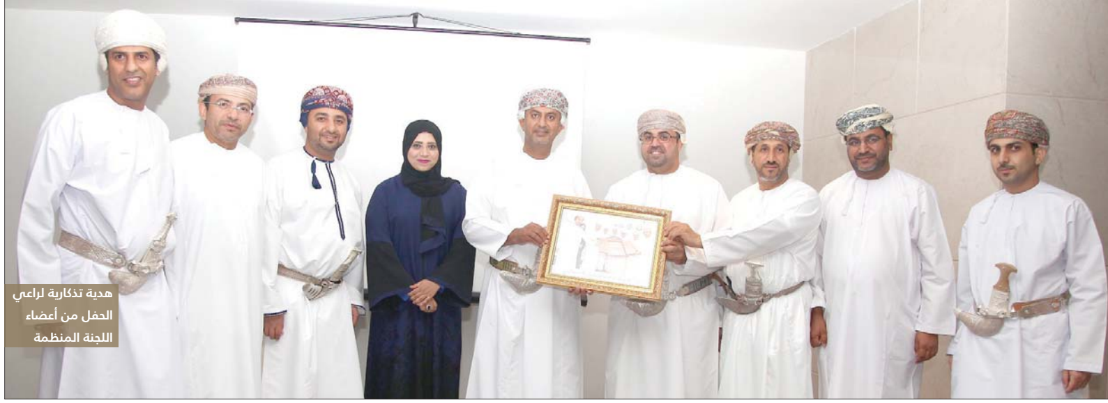
هدية تذكارية لراعي الحفل من أعضاء اللجنة المنظمة

وأضاف الحسني أن لجنة بحثت تسويق المعارض الخارجية المشتركة للمنتجات العمانية بكل جهدها ليخرج معرضها الأخير الذي أقيم في طهران بالصورة المناسبة، فقد تزامن موعد إقامته مع اجتماعات اللجنة العمانية/الإيرانية المشتركة، وتم التنسيق مع الجهات المعنية ليكون الافتتاح مميزاً تحت رعاية معالي وزير التجارة والمعادن الإيراني، وبحضور معالي الدكتور الوزير الموقر، وعدد من المسؤولين في البلدين الصديقين، حيث صاحب المعرض إقامة عدد من الفعاليات، منها اللقاء الذي جمع المسؤولين الإيرانيين مع رجال الأعمال والشركات المشاركة بالمعرض، وشهد ذلك اللقاء التوقيع على إحدى الاتفاقيات بين شركتين عمانية وإيرانية، وأوضح الحسني أن من بين نتائج المعرض الأخر، عزم منظمة تنمية التجارة الدولية الإيرانية "TPO" تخصيص قسم يعنى بالتعامل مع الشركات العمانية الراغبة في الدخول للسوق الإيراني،