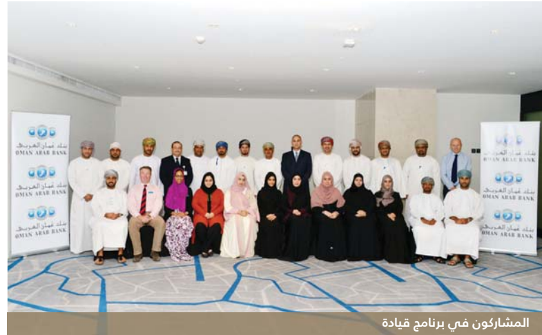
المشاركون في برنامج قيادة