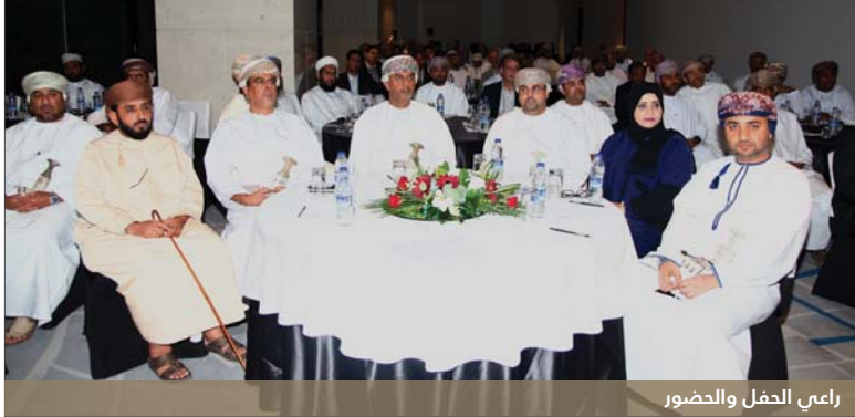
راعي الحفل والحضور

التجاري بسفارة الجمهورية الإسلامية الإيرانية في مسقط، الذين بذلوا جميعاً جهداً مقدراً في إنتاج المعرض. وتضمن اللجنة المنظمة للمعرض، من المؤسسة العاملة للمناطق الصناعية والهيئة العامة لترويج الاستثمار وتنمية الصادرات (إتراء)، وغرفة تجارة وصناعة عُمان على تعزيز الصادرات المحلية لأسواق جديدة من خلال التعريف بالشركات العمانية للمستوردين والوكلاء وأصحاب الأعمال، حيث شهدت المعارض السابقة نجاحات بارزة في كل من العاصمة الإيرانية طهران في سبتمبر الماضي، وقبلها في أديس أبابا بجمهورية إثيوبيا في إبريل الماضي، بالإضافة لنجاح إقامة المعرض في كل من الرياض بالمملكة العربية السعودية في عام 2012 والدوحة بدولة قطر في عام 2013 بالإضافة إلى دبي بدولة الإمارات العربية المتحدة في عام 2014، وفي مدينة جدة بالمملكة العربية السعودية عام 2015. ويشار إلى أن المعرض يُعد إحدى الخطوات المهمة لترويج المنتج العماني في مختلف الأسواق