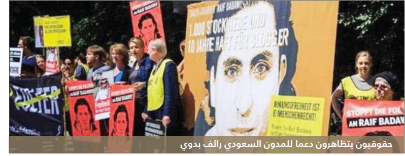
حقوقيون يتظاهرون دعماً للمدون السعودي رالف بدوي