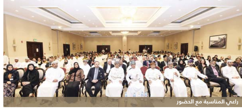
رئيسي المناسبة مع الحضور

وقد افتتح المؤتمر أمس برعاية معاليه، وينظمه المركز الوطني لعلاج الأورام بالمستشفى السلطاني ويختتم اليوم، بمشاركة أكثر من ٣٥٠ من الأطباء وطاقم التمريض العاملين في مجال الأورام مختلف مؤسسات القطاع الصحي العام والخاص من داخل وخارج السلطنة وذلك بفندق كراون بلازا مسقط.