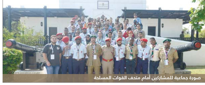
صورة جماعية للمشاركين أمام متحف القوات المسلحة