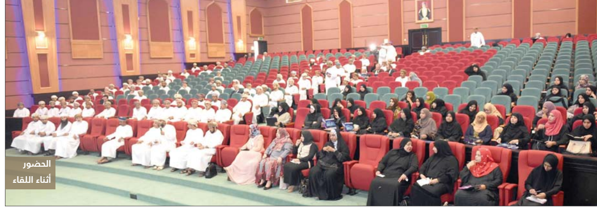
الحضور أثناء اللقاء

النمو التي حققها القطاع من حيث التوسع في تشييد المباني المدرسية، واستقطاب العديد من الطلبة من مختلف مراحل التعليم، مما نتج عنه زيادة أعداد الموظفين العاملين في المدارس الخاصة. وشهد اللقاء مناقشات موسعة بين مسؤولي الوزارة وملاك المدارس الخاصة حول عدد من الموضوعات الكثر من المشاكل، التي قد تحدثت في فترات متقاربة وإيجاد الحلول المناسبة لها في وقتها.