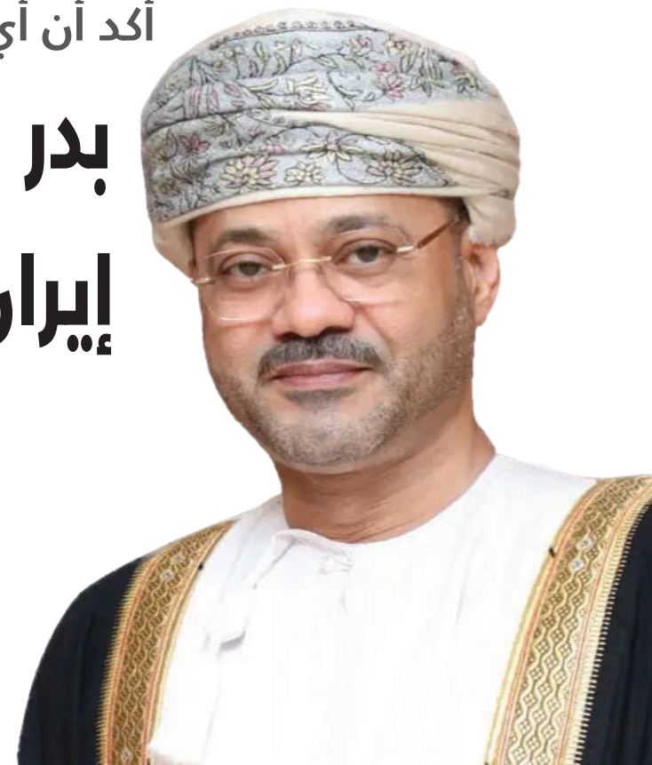
الرؤية - غرفة الأخبار

جدد معالي السيد بدر بن حمد البوسعيدي وزير الخارجية التزام سلطنة عُمان الكامل بالقانون الدولي للبحار وعدم اتخاذ أي إجراء يخالف هذا الإطار القانوني، مشيرًا إلى أن فرض رسوم على السفن العابرة لمضيق هرمز