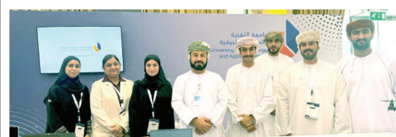
مسقط - الرؤية

شاركت جامعة التقنية والعلوم التطبيقية في مؤتمر «دور الذكاء الاصطناعي في تعزيز التحول الرقمي ورفع الكفاءة المؤسسية» الذي عقد يومي ٢٩ و٣٠ يونيو، بفندق شيراتون مسقط، تحت رعاية سعادة الدكتور علي بن عامر الشيداني وكيل وزارة النقل والاتصالات وتقنية المعلومات، وبحضور عدد من الخبراء وصناع القرار وممثلي الجهات الحكومية والمؤسسات الأكاديمية.