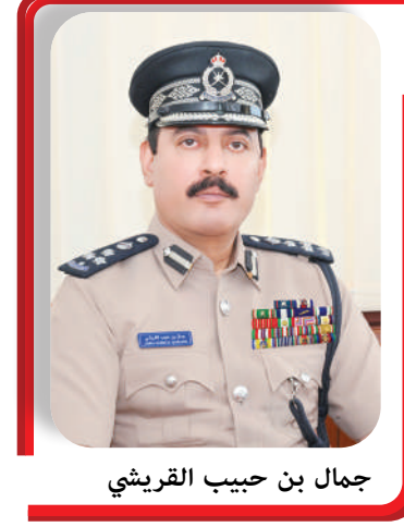
جمال بن حبيب القريشي

أكد العميد جمال بن حبيب القريشي، مدير عام التحريات والبحث الجنائي، أهمية تعزيز إجراءات السلامة داخل المنزل خلال فترة خروج الأسرة للوقاية من جرائم السرقة، مشيراً إلى أن من أبرز الخطوات الوقائية التي يُصح باتباعها قبل مغادرة المنزل التأكد من إحكام إغلاق الأبواب والنوافذ، وفصل الأجهزة الكهربائية غير الضرورية، إلى جانب الاستعانة بأحد الأقارب أو الجيران الموثوقين لمتابعة المنزل بشكل دوري للتأكد من سلامة المنزل، وإزالة الإعلانات التجارية من على الأبواب الخارجية، إذ إنها تبعث مؤشراً على خلو المنزل من قاطنيه، واستخدام مؤقتات تشغيل الإنارة لإعطاء انطباع بوجود حركة داخل المنزل، إلى جانب استخدام أنظمة الأمان الذكية المرتبطة بالهواتف، التي تتيح خاصية مراقبة المكان بالصوت والصورة في أي وقت.