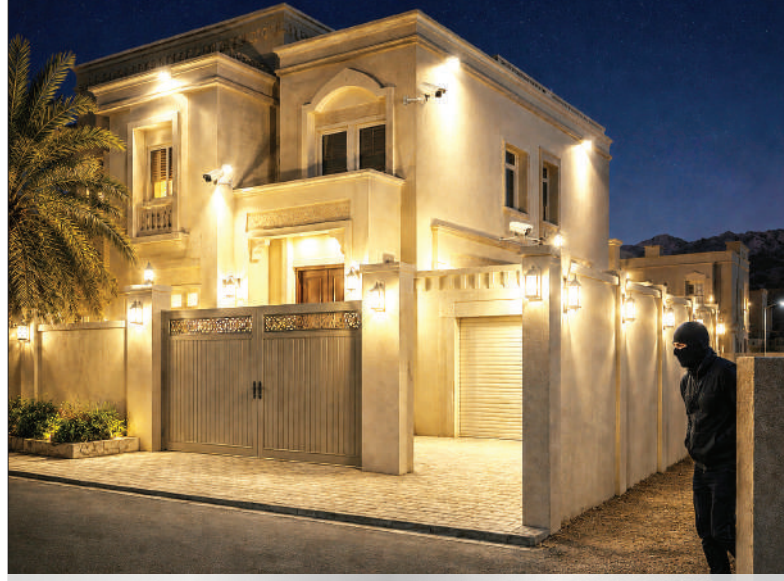
صورة مولدة بالذكاء الاصطناعي للأغراض التحريية فقط

والبحث الجنائي من بعض الأخطاء الشائعة التي يرتكبها البعض قبل السفر، مثل ترك المفاتيح في أماكن متعارف عليها، كأسفل السجاد، وإهمال تركيب وفحص أنظمة الحماية، أو ترك مقتنيات ثمينة في أماكن ظاهرة، مما يسهل الوصول إليها، وهي ممارسات قد تسهل استهداف المنازل من قبل الآخرين.