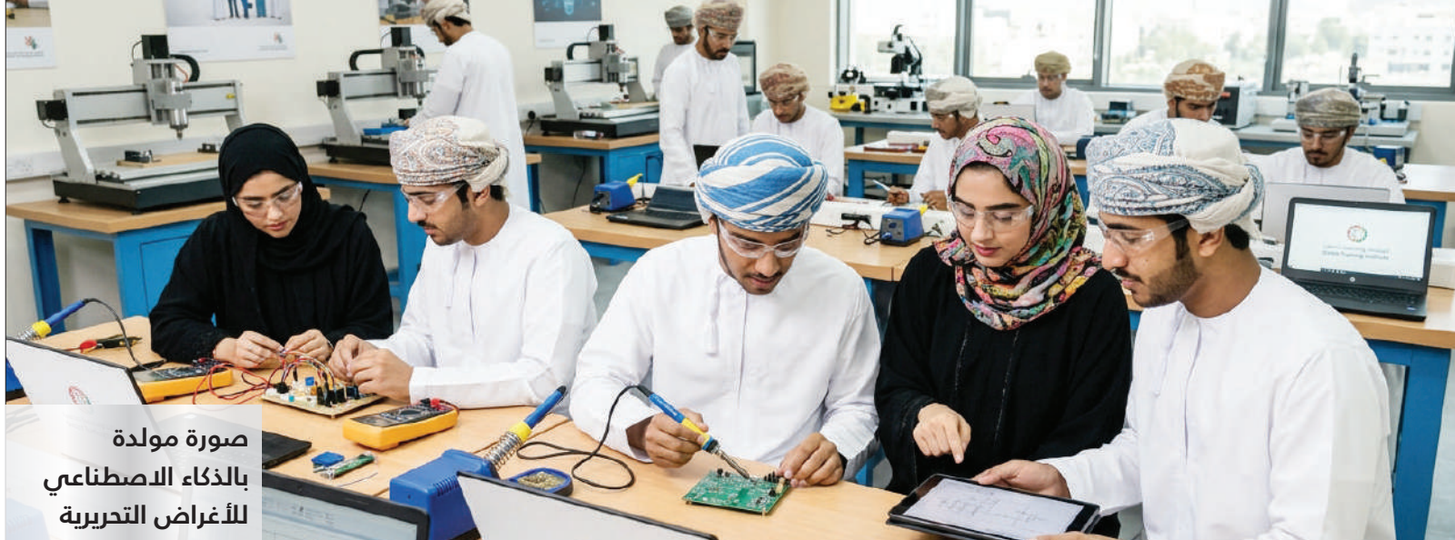
صورة مولدة بالذكاء الاصطناعي للآغراض التدريبية