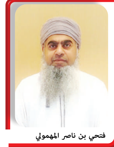
فتحي بن ناصر المهمودي

وأكدت الوزارة أن هذه الفرص تستهدف المواطنين العُمانيين المستوفين للشروط المحددة، بما يساهم في توفير فرص عمل للقوى العاملة الوطنية ودعم المؤسسات الصغيرة والمتوسطة، مشيرة إلى استمرار جهودها في