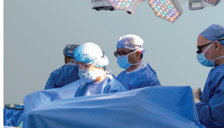
مسقط - العمانية

ويجسد هذا الإنجاز استمرار توظيف وتطوير الخدمات التخصصية الدقيقة، وتعزيز القدرة على تقديم رعاية صحية متقدمة تركز على المعرفة والخبرة والابتكار.