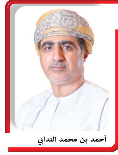
أحمد بن محمد الندوي

الأهداف التشريعية للمجلس في مختلف القطاعات. وأشار سعادته إلى أن الجلسة الثانية والعشرين للمجلس المقررة اليوم الإثنين، ستشهد مناقشة مقترح مشروع قانون تنظيم منع قطع الخدمات الأساسية عن الأسر المعسرة والمُسرحين والحالات الإنسانية، المقدم