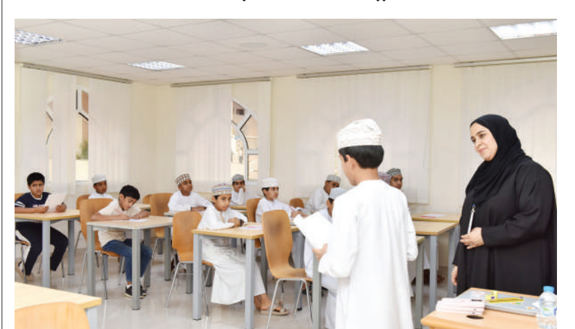
مسقط - الرؤية

أطلقت هيئة الخدمات المالية أمس برنامج «المستثمر الواعد» الصيفي، بالتعاون مع جامعة التقنية والعلوم التطبيقية فرع مسقط، بمشاركة ٦٠ طالبًا وطالبة من مختلف المحافظات؛ وذلك خلال الفترة من ٢١ يونيو الجاري إلى ٢ يوليو المقبل.