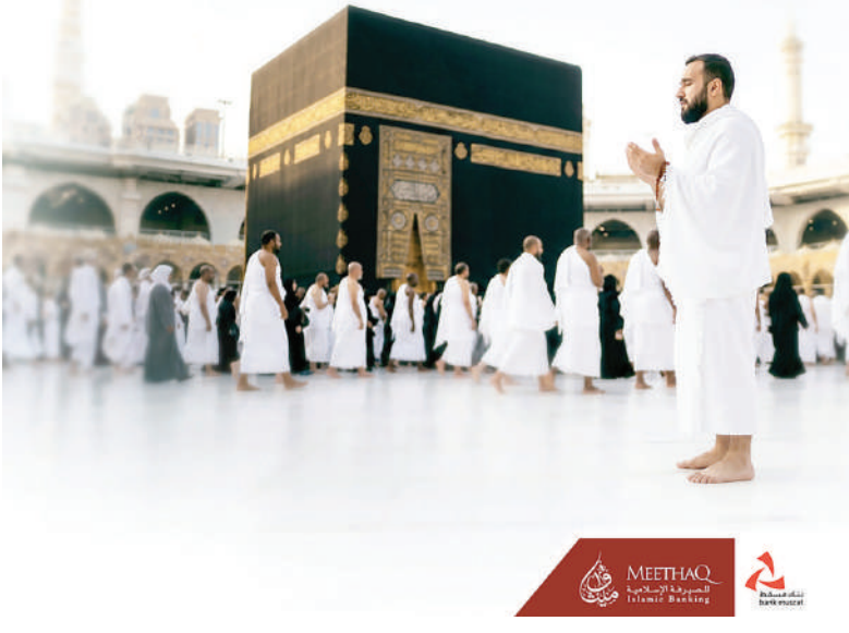
MEETHAQ ميثاق للصيرفة الإسلامية Islamic Banking