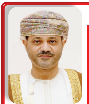
بدر بن حمد البوسعيدي