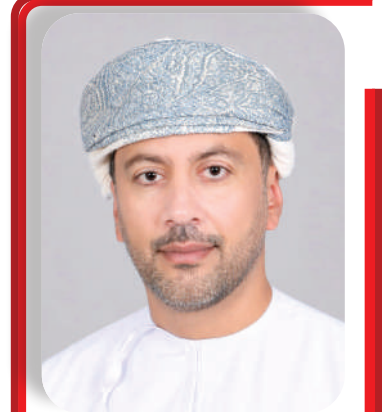
د. نيهان بن راشد المعولي

وتضمن برنامج الاستقبال لقاءً تعريفياً تناول مكونات البرنامج الدراسي وآليات الدراسة والتدريب واللوائح الأكاديمية والتنظيمية المعمول بها في المعهد، إضافة إلى جلسة حوارية للإجابة على استفسارات الدارسين المتعلقة بالجوانب الأكاديمية والتدريبية.