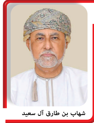
شهاب بن طارق آل سعيد

وأشار سموه إلى أن النجاحات التي حققها النادي منذ عام ٢٠١٩ وحتى الآن -الترويج بلقب الدوري العام للمرة الخامسة في تاريخه والثالثة على التوالي في