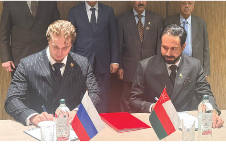
مسقط - الرؤية

أسدل الستار على أعمال منتدى ومعرض كازان الدولي لمُنتجات الحلال ٢٠٢٦، والذي شهد مشاركة واسعة من أكثر من ١٣٣ دولة حول العالم، وسط حضور رسمي واقتصادي وإعلامي كبير، عكس المكانة المتنامية التي يحظى بها المنتدى كواحد من أبرز الفعاليات الاقتصادية الدولية المتخصصة في صناعة ومنتجات الحلال. وسجلت سلطنة عُمان حضورًا بارزًا خلال أعمال المنتدى، من خلال أكبر وفد اقتصادي وتجاري يُشارك في الحدث، حيث ضم الوفد العُماني نحو ٣٠ من رجال الأعمال، يمثلون غرفة تجارة وصناعة عُمان، إلى جانب عدد من الجهات الحكومية، ومؤسسات الشركات الصغيرة والمتوسطة، التي شاركت بجناح خاص ضمن معرض «كاسبو كازان» الدولي، لاستعراض المنتجات والخدمات العُمانيّة والترويج للفرص الاستثمارية الواعدة في السلطنة. وشهد المنتدى جلسات مباشرة ولقاءات ثنائية بين رجال الأعمال الروس ونظرائهم