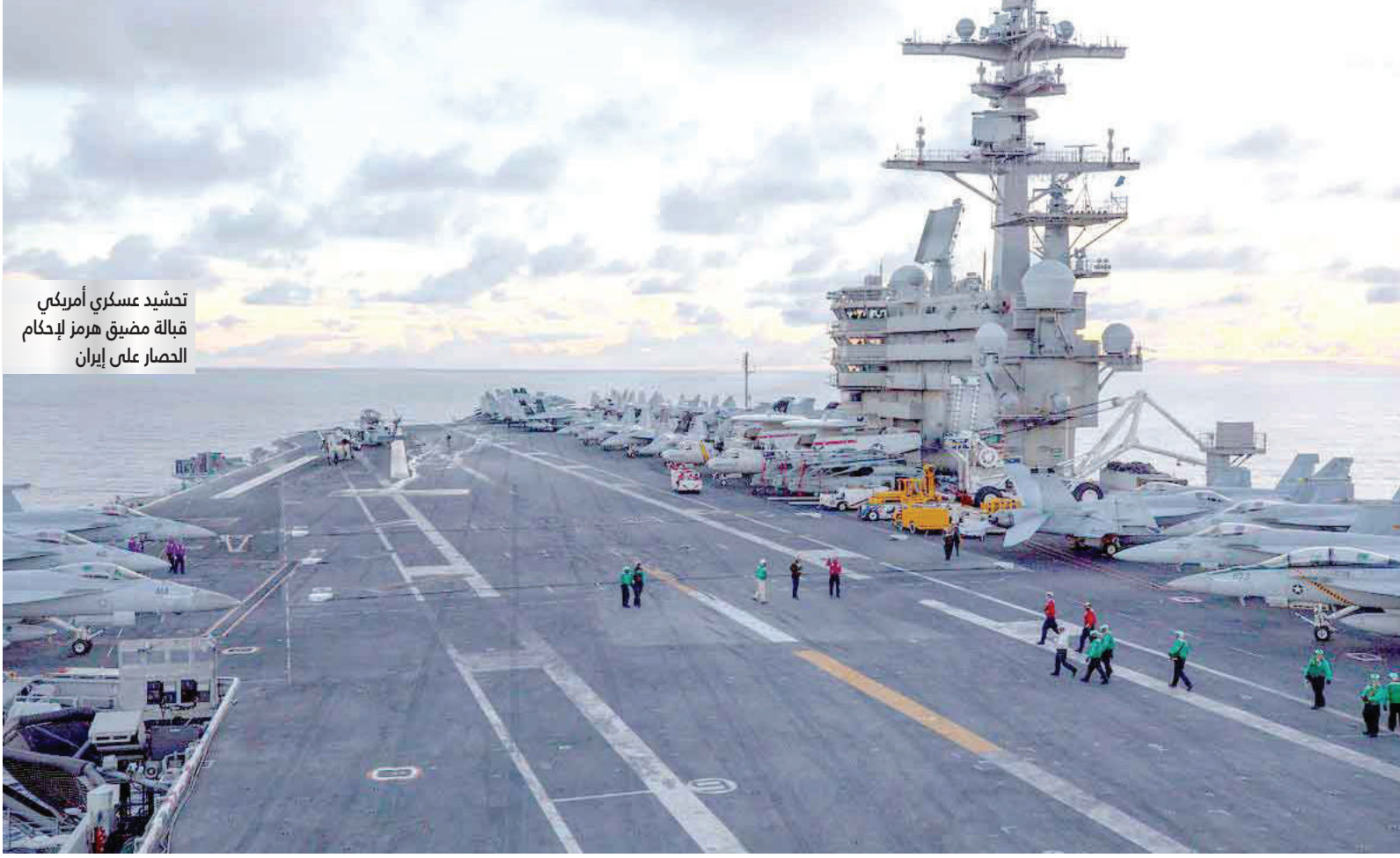
تشييد عسكري أمريكي قبالة مضيق هرمز لإحكام الحصار على إيران

ومن جهة ثانية، قال الرئيس الأمريكي دونالد ترامب أمس إن إيران تريد التفاوض وإبرام اتفاق، مضيفاً أن الولايات المتحدة تحقّق نتائج جيدة للغاية مع إيران وأن الأمور تسير بسلاسة بالغة. وأضاف ترامب في حفل أقيم في البيت الأبيض "تحقق نجاحاً كبيراً في إيران."