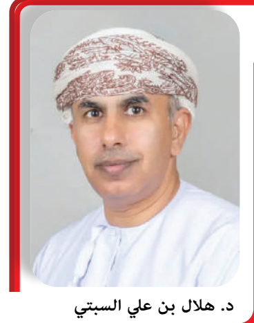
د. هلال بن علي السبتي

يرعى معالي الدكتور هلال بن علي السبتي وزير الصحة، صباح اليوم، انطلاق أعمال النسخة السادسة من مؤتمر عُمان للأمن الإلكتروني، والذي يتناول هذا العام "الأمن السيبراني في القطاع الصحي"، وذلك بتنظيم من جريدة الرؤية بالتعاون مع مركز الدفاع الإلكتروني وأكاديمية الأمن الإلكتروني المتقدم، وبشراكة مع وزارة الصحة.