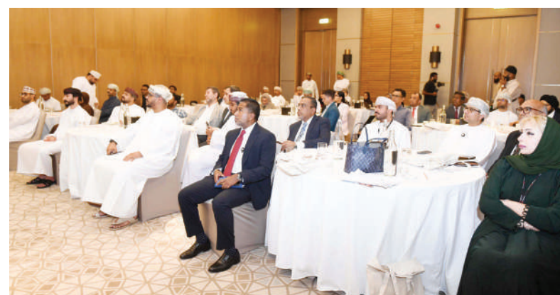
مسقط - الرؤية

نظمت كريدت عُمان وبالتعاون مع المكتب التجاري العُمانى في الولايات المتحدة الأمريكية وبرنامج «لدائن» التابع لمجموعة أوكيو، برنامجاً مخصصاً لمصنعي البلاستيك العُمانيين المشاركين في مُسرع تصدير البلاستيك، وهو برنامج يمتد لنحو ٦ أسابيع ويعتمد على نظام الدفوعات؛ بهدف دعم شركات البلاستيك العُمانية التي تسعى إلى دخول السوق الأمريكية أو التوسع فيها.