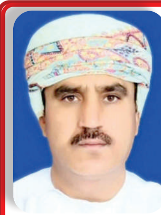
سعيد بن سيف السديري