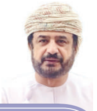
خالد بن عمر المرهون **

مجالا عدة للصدقة والتجارة الحرة وامتيازات متبادلة للبحارة والتجار. وشكلت هذه المعاهدة نقطة انطلاق لتعزيز الروابط الثنائية عبر العقود. ومن مشاهد هذه العلاقة التاريخية بين البلدين، وصول السفينة "سلطانة" إلى نيويورك في عام 1840، بقيادة أحمد بن النعمان الكعبي، محملة برسائل وهدايا للرئيس الأمريكي مارتن فان بورين، ليكون أول مبعوث، وأول سفينة خليجية وعربية تصل إلى السواحل الأمريكية في مهمة دبلوماسية. وبدا، تعد سلطنة عُمان من أوائل دول العالم التي عاقت بالولايات المتحدة الأمريكية، لتحقيق الأمن والثانية عربيًا - حسب علمي - بعد المملكة المغربية. وبدورها، قامت الولايات المتحدة بإنشاء علاقة بالولايات المتحدة الأمريكية، لتحقيق الأمن والاستقرار في هذه المنطقة المضطربة، لقد صدم تصريح الرئيس الأمريكي - والذي تبنته بكل أسف وزارة الخارجية الأمريكية ووزير الخزانة الأمريكي - الداخل الأمريكي قبل بقبسة دول العالم، التي تعلم مدى اثران وحيادية السياسة الخارجية العمانية، منذ عهد المغفور له بإذن الله السلطان قابوس بن سعيد، طيب الله ثراه، وهو الأمر الذي يميز كذلك السياسة الخارجية في عهد حضرة صاحب الجلالة السلطان هيثم بن طارق المعظم، حفظه الله ورعا. وما يميز هذه السياسة المعتدلة والمترتبة الأودار التي كان لها أكبر الأثر في خفض التصعيد في عدد من الأزمات السياسية الحادة. حتى أصبحت سلطنة عُمان مصدر إعجاب وثناء من كل دول العالم، وتحديدًا من كل الإدارات الأمريكية السابقة.