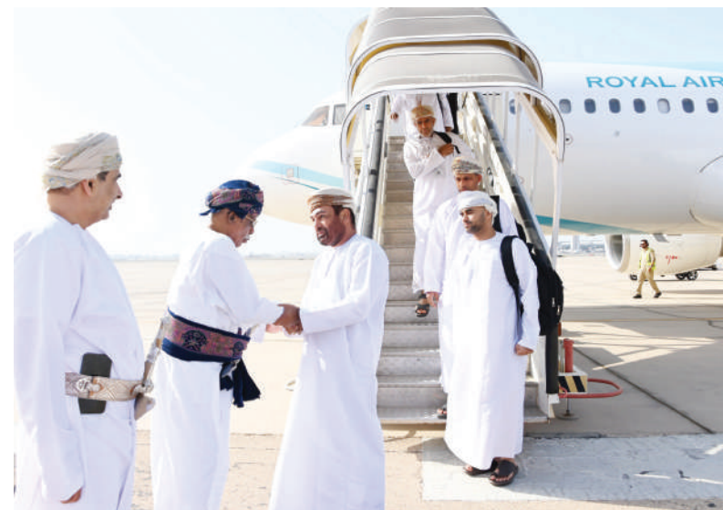
مسقط - العمانية

المختلفة لزراعته. وبدأت معاصر قصب السكر في ولاية بهلاء استقبال كميات من محصول قصب السكر من المزارع في قرى الولاية لإنتاج السكر الأحمر الذي يستخدم في العديد من الصناعات الغذائية التقليدية مثل صناعة الحلوى العمانية وإنتاج عسل قصب السكر