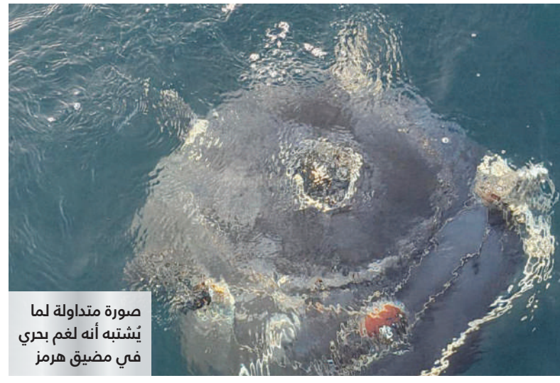
صورة متداولة لما يُشبهه أنه لغم بحري في مضيق هرمز

البوسعيدي وزير الخارجية، اتصالاً هاتفياً من معالي الدكتور سيّد عباس عراقجي، وزير الخارجية في الجمهوريّة الإسلاميّة الإيرانيّة. وجرى خلال الاتصال استعراض آخر المستجدات الإقليمية، وتبادل وجهات النظر بشأن الجهود المبذولة لدعم الحلول السياسيّة المُستدامة والعدالة بما يُسهم في تعزيز الأمن والاستقرار في المنطقة. وأكد الجانبان على التزامهما بضمان حرية الملاحة البحرية وأمنها عبر مضيق هرمز وفقاً لمسؤولياتهما السيادية على مياهما الإقليمية وبما يتوافق مع القانون الدولي ويحفظ مصالح جميع الأطراف الإقليمية والدولية.