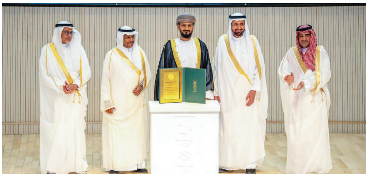
مكة المكرمة - العمانية

حصلت سلطنة عُمان ممثلة في بعثة الحج العمانية على جائزة «لبيتم» للتميز في خدمات ضيوف الرحمن - الجائزة الفضية - ضمن مسار الجوائز الإقليمية لفئة مكاتب شؤون الحج على مستوى دول العالم الإسلامي تقديرًا لتمييز البعثة في تقديم الخدمات المتكاملة لحجاج سلطنة عُمان، ورفع مستويات الجودة والامتثال ورضا الحجاج خلال رحلة الحج.