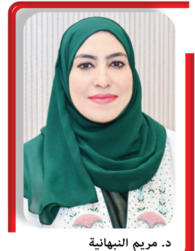
د. مريم النهائية

لمؤسسات التعليم العالي، على عقد لقاءات مباشرة مع أعضاء المجالس الاستشارية الطلابية بصفتهم ممثلين للطلبة، للاستماع إلى آرائهم ومناقشة مختلف القضايا المرتبطة بالحياة الجامعية والعملية التعليمية. وأكدت كذلك حرص الوزارة على إشراك أعضاء المجالس الاستشارية الطلابية في عدد من الفعاليات والبرامج التي تنظمها، دعماً لدورها في العمل الطلابي والمشاركة المجتمعية، وتعزيزاً لقدراتهم القيادية والتنظيمية. واختتمت الدكتورة مريم بنت بلعرب النهائية المديرية العامة للجامعات والكليات الخاصة حديثها بالتأكيد على أن اهتمام الوزارة بالمجالس الاستشارية الطلابية يأتي متوافقاً مع مستهدفات رؤية عُمان ٢٠٤٠، التي تركز على بناء جيل واع ومبادر وقادر على الإبداع، والمشاركة الفاعلة في تنمية المجتمع وصناعة المستقبل.