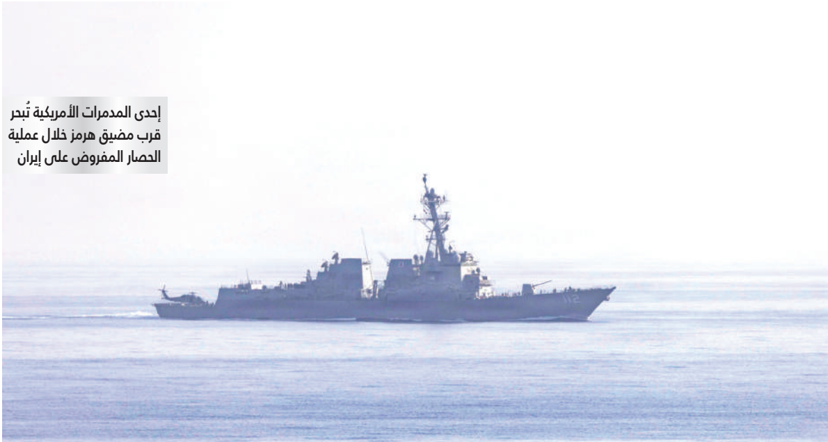
إحدى المدمرات الأمريكية تُبحر قرب مضيق هرمز خلال عملية الحصار المفروض على إيران

« بدر بن حمد والمبعوث الشخصي للأمين العام للأمم المتحدة يبحثان تطورات الأوضاع الإقليمية » « سلطنة عُمان تؤكد دعمها للجهود الأممية الرامية لتغليب الدبلوماسية » « المبعوث الأممي يُشيد بالدور البناء لسلطنة عُمان وجهود الوساطة لتعزيز الاستقرار »