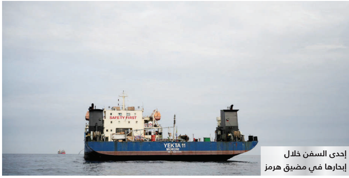
إحدى السفن خلال إبحارها في مضيق هرمز

ويبحث حضرة صاحب الجلالة السلطان هيثم بن طارق المعظم - حفظه الله ورعاه - خلال اتصال هاتفي أمس مع دولة ساناي تاكيتشي رئيسة وزراء