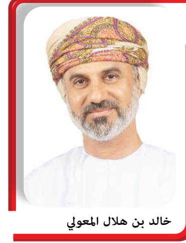
خالد بن هلال الموعي

الحرص على دعم القضايا والموضوعات التي تحظى باهتمام المجالس التشريعية الخليجية والعربية والإسلامية. ومن المقرر أن يشارك الوفد في أعمال الدورة (٢١٧) للمجلس الحاكم للاتحاد، والجمعية العامة للاتحاد، ومنتدى البرلمانيين الشباب، وغيرها من الاجتماعات والمحاضرات. فيما سيشارك سعادة الشيخ أحمد بن محمد السديني أمين عام المجلس، في اجتماعات جمعية الأئمة العاملين للبرلمانات الوطنية.