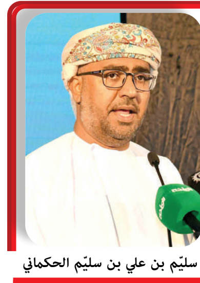
سليم بن علي بن سليم الحكاماني

عقدت هيئة حماية المستهلك، الأربعاء، لقاءً إعلامياً لاستعراض الإنجازات خلال العام الماضي ٢٠٢٥، والمخطط المستقبلية، وذلك في إطار نهج مؤسسي يقوم على الشفافية والافتتاح على المجتمع وتعزيز الثقة بالدور الرقابي والخدمي والتوعوي الذي تضطلع به الهيئة. واستعرض سعادة سليم بن علي بن سليم الحكاماني رئيس هيئة حماية المستهلك، أبرز ما تحقّق خلال العام ٢٠٢٥، في الجوانب الرقابية والخدمية والتوعوية، كما تطرّق إلى خطط الهيئة ومشاريعها وبرامجها المزمع تنفيذها خلال العام ٢٠٢٦، إضافة إلى المبادرات التي تعتمدهم الهيئة المضي فيها خلال المرحلة المقبلة بما يعزز أثرها، ويوسع نطاق خدماتها، ويرفع كفاءة أدائها. وتضمن اللقاء جلسة حوارية مفتوحة للرد على الأسئلة والاستفسارات، والتعريف بدور الهيئة في حماية