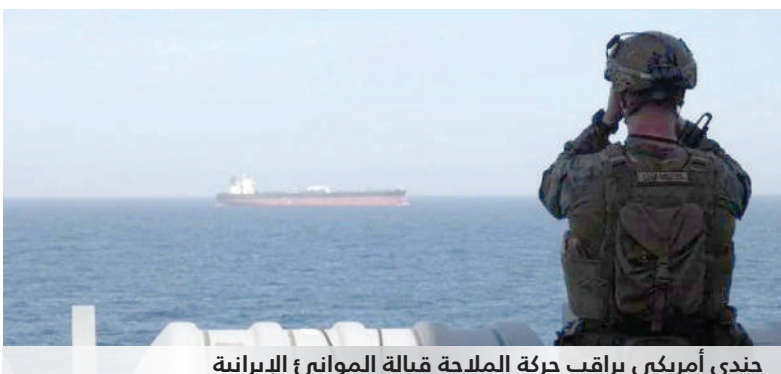
جندي أمريكي يراقب حركة الملاحه قبالة الموانئ الإيرانية

كهرباء وكل جسر في إيران. «وهذا قاتل» لن يتعامل بلطف بعد الآن!». 12