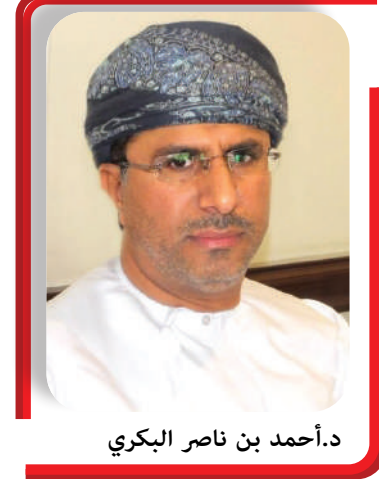
د. أحمد بن ناصر البكري

تعمل وزارة الثروة الزراعية والسمكية وموارد المياه على تعزيز الأمن الغذائي بالتعاون مع مختلف الشركاء، حيث جرى تحقيق نتائج إيجابية ملموسة خلال تنفيذ الخطة الخمسية العاشرة (٢٠٢١-٢٠٢٥)، ليصل عدد المشاريع الاستثمارية المنفذة إلى ٤٩٣ مشروعاً، بإجمالي استثمارات يُقدَّر بنحو ١,٩ مليار ريال عُمانى وفقاً لدراسات الجدوى لتلك المشاريع الاستثمارية.