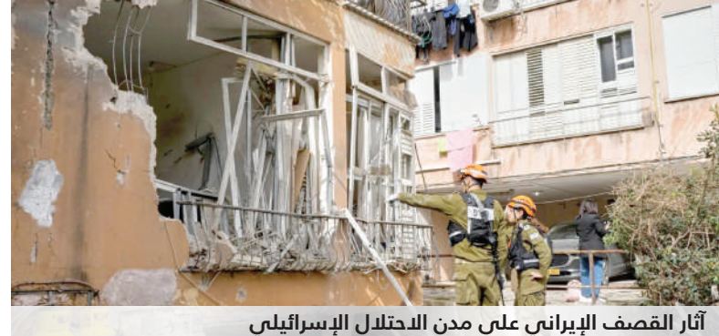
آثار القصف الإسرائيلي على مدن الاحتلال الإسرائيلي

الإيرانية منذ بداية الحرب، ترك وزير الخارجية عباس عراقجي الباب مفتوحاً من حيث المبدأ لإجراء محادثات سلام مع الولايات المتحدة بواسطة من باكستان، لكنه لم يبد أي إشارة على استعداد طهران للرضوخ لمطالب ترامب. وقال عراقجي في منشور على منصة إكس "نشعر بامتنان شديد لباكستان على جهودها ولم نرفض قط الذهاب إلى سلام اباد. ما يهمنا هو شروط وقف نهائي ودائم للحرب غير الشرعية التي فرضت علينا". 12