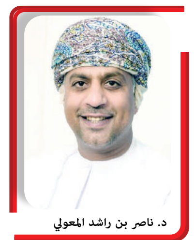
د. ناصر بن راشد المعوي

◀ البرامج تهدف إلى تحقيق أثر اقتصادي وتنموي ملموس ضمن أطر زمنية محددة