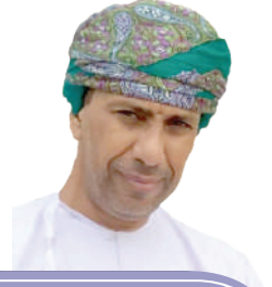
د. إبراهيم بن سالم السيابي

يفتح الباب أمام الشك والتصعيد. وعليها أن تعمل على طمأننة محيطها الإقليمي وأن تستمع إلى هواجس دول الجوار، لأن الأمن لا يُبنى بشكل منفرد؛ بل عبر توازنات دقيقة. وعليها أن تلتزم بأن يكون حضورها خارج حدودها ضمن الأعراف الدبلوماسية المعترف بها، وبما يحترم سيادة الدول، ويُجَنَّب المنطقة مزيداً من مسارات الاحتكاك.