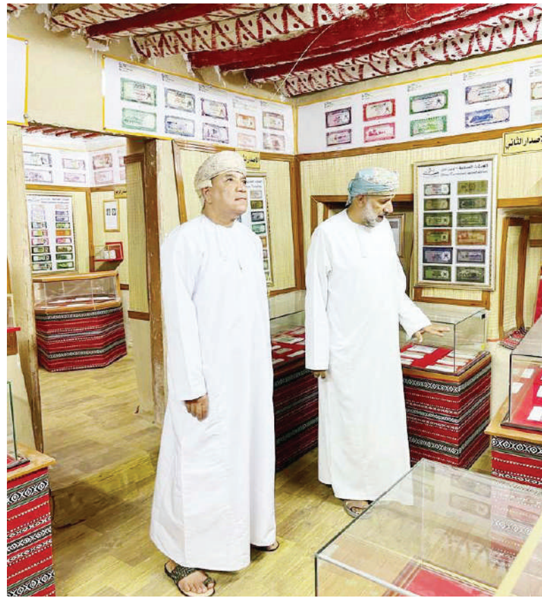
الرؤية - ناصر أبووعون

في متحف الحمراء للنقود ستقع عينك على رزنامة من العملات المؤرشفة والمحفوظة في مكان زجاجية ملحق بها لوحات شاحرة بالعربية والإنجليزية بداية من (الروبية الهندية) التي تداولها أهل عُمان والخليج قبل طباعة الأوراق النقدية الخاصة بدولهم قبل سبعينيات القرن العشرين. ومع التدقيق أثناء تجوالك بين غرفات المتحف ستشاهد عملات من زنجبار في زمن حكم السلطان برغش ومجموعة من العملات التي سكت في عهد السلطان فيصل بن تركي وابنه السلطان تيمور وعملات عصر السلطان سعيد بن تيمور المسكوكة في ظفار ومسقط، ومجموعة عملات جلالة السلطان قابوس طيب الله ثراه، المتداولة في السوق أو العملات المتداولة.