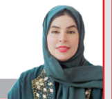
المتغطي بالأمريكان عربان هند الحمدانية