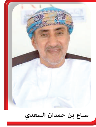
سباغ بن حمدان السعدي

ينظم فرع غرفة تجارة وصناعة عُمان بمحافظة جنوب الباطنة، وبالتعاون مع مكتب محافظ جنوب الباطنة، ملتقى الفرص الاستثمارية ٢٠٢٦، برعاية معالي الشيخ صباح بن حمدان السعدي، أمين عام الأمانة العامة للاحتفالات الوطنية، وذلك في السادس من أبريل المقبل بقاعة قصر النعمان بولاية بركاء. يأتي الملتقى تحت شعار «تنمية مستدامة وشراكة اقتصادية شاملة». بهدف استعراض الفرص الاستثمارية الواعدة في مختلف القطاعات الاقتصادية بالمحافظة، وتوسيع قاعدة المستثمرين المحليين والدوليين، حيث يُعد نقطة لقاء استراتيجية بين صناعات القرار، والجهات الحكومية، والمستثمرين، بهدف توسيع دائرة التعاون والشراكات الاقتصادية