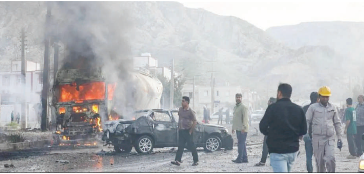
الرؤية - غرفة الأخبار

أعربت سلطنة عُمان عن إدانتها واستنكارها الشديد للهجوم الذي استهدف معسكراً وإحدى منشآت إنتاج الطاقة الكهربائية وتغذية المياه في دولة الكويت الشقيقة.