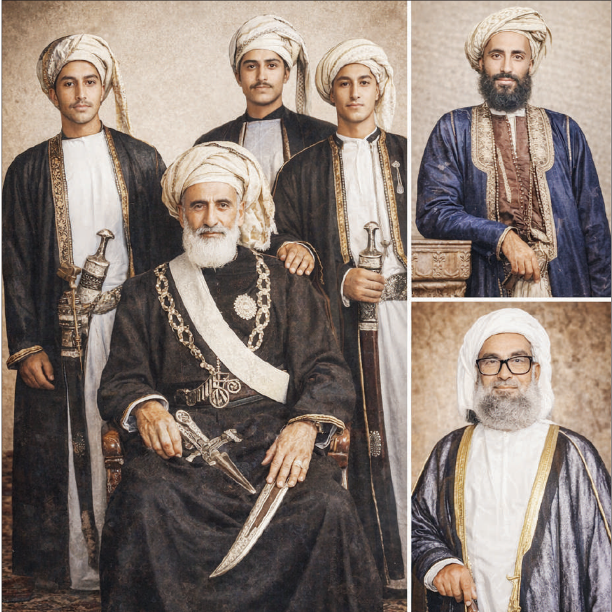
صور مولدة بالذكاء الاصطناعي للأغراض التحريرية فقط