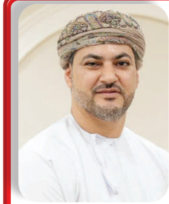
غالب بن سعيد المعمري

وأكد سعادة المهندس غالب بن سعيد المعمري وكيل وزارة التجارة والصناعة، وترويج الاستثمار للتجارة والصناعة، أن قانون التنظيم الصناعي الخليجي يمثل خطوة استراتيجية نحو تعزيز التكامل الصناعي بين