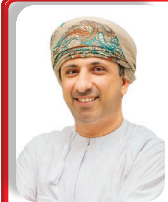
خالد بن سليم القصبي

دول المجلس، مشيراً إلى أن توحيد الأطر التنظيمية والتشريعية يساهم في جذب الاستثمارات ورفع القدرة التنافسية إقليمياً ودولياً. وأضاف سعادته أن القانون سيعزز انتقال الاستثمارات والخبرات والتقنيات الصناعية بين الدول الأعضاء بما يرفع كفاءة الإنتاج ويعزز دور القطاع الصناعي في التنويع الاقتصادي وتحقيق مستهدفات الاستراتيجيات الوطنية.