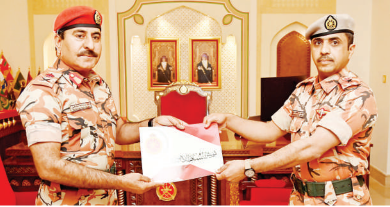
مسقط - العُمانية

سَلَّمَ اللواء الرُّكن مطر بن سالم البلوشي قائد الجيش السُّلْطاني العُماني أمس بمعسكر المرتفعة شهادة البراءة السُّلْطانية لعدد من ضباط الجيش السُّلْطاني العُماني. وقد هنأ اللواء الرُّكن قائد الجيش السُّلْطاني العُماني الضباط الخريجين بمناسبة تخرُّجهم وتلقَّيهم التَّدريب العسكري، مبارِكاً لهم نيل الثقة السَّامية الكريمة من لدن جلالَةِ القائد الأعلى - حفظه اللهُ ورعاهُ. كما كرَّم اللواء الركن قائد الجيش السُّلْطاني العُماني عدداً من الضُّباط المَجيدين تقديراً لجهودهم وإجادتهم في مختلف المسارات الوظيفيَّة والدورات، مشيداً بالمستوى