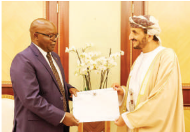
مسقط - العُمانية

تسلَّم سعادة الشيخ خليفة بن علي الحارثي، وكيل وزارة الخارجية للشؤون السياسية، أمس، نسخاً من أوراق اعتماد عددٍ من أصحاب السعادة السفراء المعيّنين لدى سلطنة عُمان.