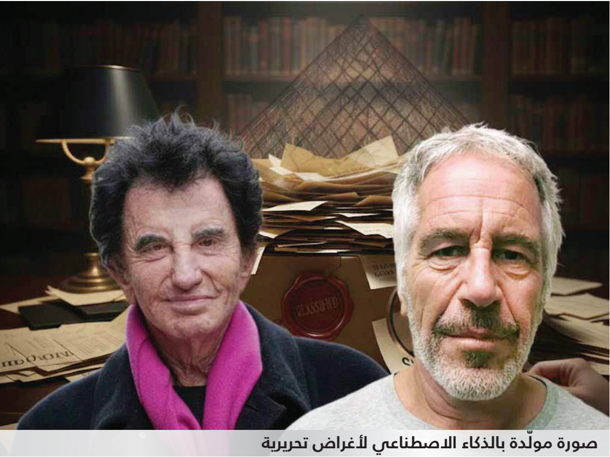
صورة مودّدة بالذكاء الاصطناعي لأغراض تحريرية

وتقديم شهادة أمام الكونغرس الأمريكي، على خلفية علاقته بالملياردير الراحل جيفري إيستين. وقالت رئاسة الوزراء البريطانية في بيان، إن موقف ستارمر جاء عقب ظهور ادعاءات جديدة بحق مانديلسون في وثائق حديثة نشرتها وزارة العدل الأمريكية الأسبوع الماضي، ضمن ملفات قضية إيستين، الذي وُجد ميتاً في زنزانته عام ٢٠١٩ أثناء محاكمته بتهمة إدارة شبكة استغلال جنسي لقاصرات. وأوضح البيان أن مانديلسون، الذي أُقيل من منصبه سفيراً بواشنطن في سبتمبر ٢٠٢٥ بعد تعيينه في فبراير من العام نفسه، بات مطالبا بالإدلاء بكل ما لديه من معلومات. أما في فرنسا، استدعت وزارة الخارجية رئيس معهد العالم العربي في باريس، ووزير الثقافة الفرنسي الأسبق، جاك لانغ، على خلفية علاقته برجل الأعمال المتهم بالاتجار بالقاصرات جيفري إيستين، وورود اسمه ضمن الوثائق المتعلقة به. وذكرت تقارير إعلامية فرنسية أن لانغ