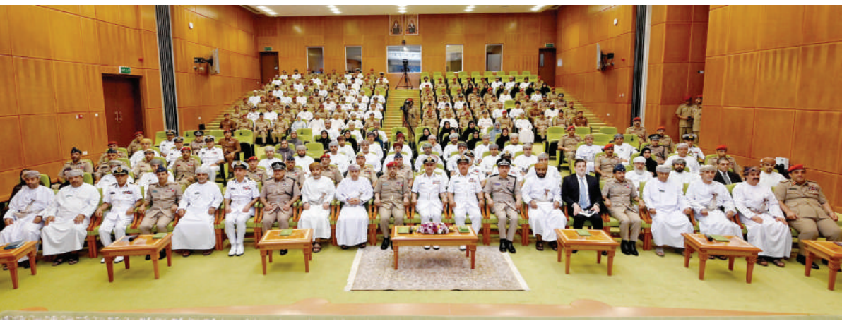
مسقط - العُمانية

بدأت أمس بكلية الدفاع الوطني بأكاديمية الدراسات الاستراتيجية والدفاعية فعاليات الندوة السنوية للقضايا الاستراتيجية بعنوان "الشباب وصنع القرار الوطني من التمكين إلى التأثير"، تحت رعاية اللواء الركن بحري سيف بن ناصر الرحبي قائد البحرية السلطانية العُمانية. وشارك في الندوة عددٌ من الجهات الحكومية ضمن منهاج ومقررات الدورة الثالثة عشرة بالكلية وتستمر فعالياتها حتى ١٢ من فبراير الجاري، وتضمنت محاور عدة، أهمها: المشاركة وصناعة القرار، والمواطنة والانتماء، والإبداع والابتكار، إضافة إلى التمكين الرقمي المستدام.