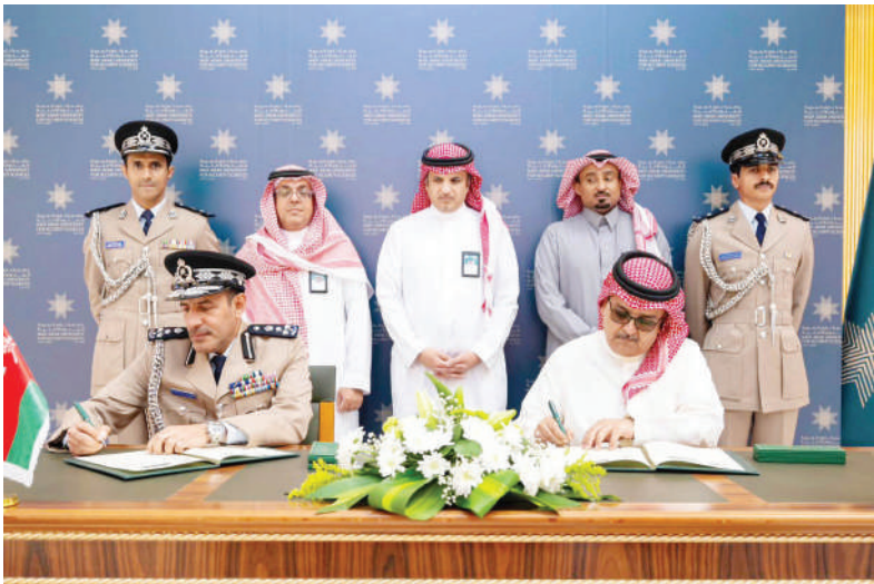
مسقط - الرؤية

وقَّعت شرطة عمان السلطانية ممثلة في أكاديمية السلطان قابوس لعلوم الشرطة، مذكرة تفاهم مع جامعة نايف العربية للعلوم الأمنية، بهدف تعزيز التعاون المشترك وبناء شراكة استراتيجية لتجويد التعليم والتدريب في المجالات الأمنية والشرطية، وبما يواكب التحولات المتسارعة في المشهد الأمني العالمي. وتهدف المذكرة إلى دعم مجالات الأمن الذي والتحليل الاستباقي للتهديدات، ورفع كفاءة الكوادر الأمنية من خلال تبادل الخبرات والمعرفة العلمية والتطبيقية.