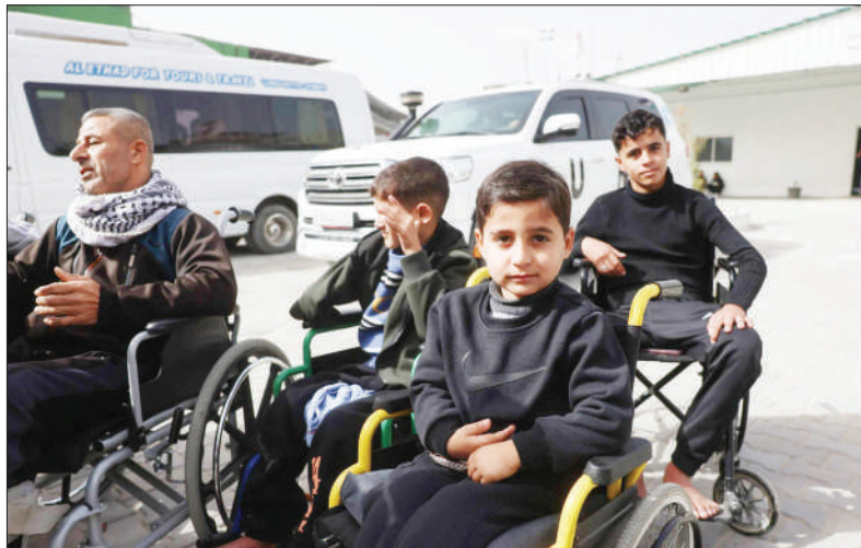
مرضى فلسطينيون خلال انتظار إجلائهم للعلاج خارج غزة

غزة: حركة بطيئة في معبر رفح.. و3 شهداء مع استمرار قصف الاحتلال