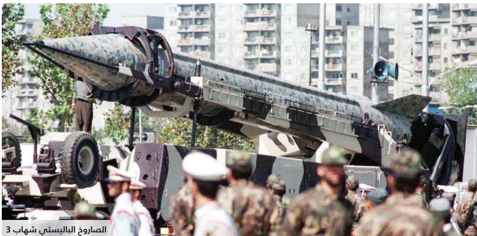
الصاروخ الباليستي شهاب 3