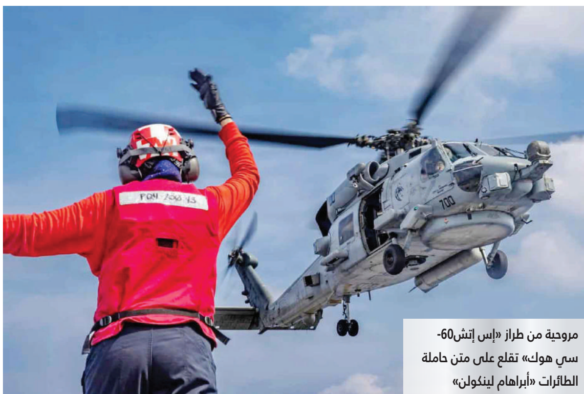
مروحية من طراز «إس إتش-60 سي هوك» تقلع على متن حاملّة الطائرات «أبراهام لينكولن»

خبير عسكري: واشنطن ستوجه ضربة لإيران بنسبة 100 %