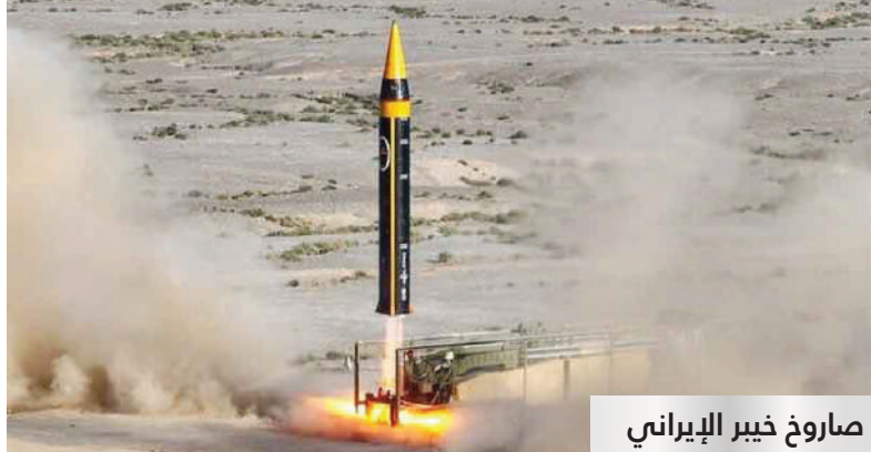
صاروخ خبير الإيراني