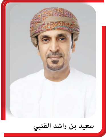
سعيد بن راشد القتيبي

وسياحية وجغرافية مختلفة، وتنوع ثري في الأنشطة التجارية والصناعية والاستثمارية. وأوضح أن إجمالي عدد المشاريع التي تم الانتهاء منها والجاري تنفيذها ضمن برنامج تنمية المحافظات ارتفع من ٩٤١ مشروعاً في نهاية عام ٢٠٢٤ إلى ١٠٨٩ مشروعاً في نهاية الثاني من عام ٢٠٢٥، وبلغ إجمالي الصرف على هذه المشاريع ١٢٧ مليون ريال عُمانى وذلك خلال الفترة من عام ٢٠٢١ حتى نوفمبر ٢٠٢٥، وبلغت مخصصات البرنامج في الميزانية العامة للدولة للسنة المالية ٢٠٢٥ حوالي ٤٤ مليون ريال عُمانى، وقد تم من خلال مشاريع برنامج تنمية المحافظات إسناد ٩٥٠ عقداً للمؤسسات الصغيرة والمتوسطة حتى نوفمبر عام ٢٠٢٥. وقال إن عدد الفرص الوظيفية المباشرة التي تحققت ضمن تنفيذ البرنامج حتى