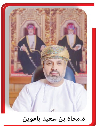
د.محماد بن سعيد باعوين

مع مؤسسات القطاع الخاص، وإشراف ومتابعة مباشرة من لجان حوكمة التشغيل، وتشمل هذه الفرص قطاعات اقتصادية استراتيجية، من بينها: الصناعة، النفط والغاز، النقل واللوجستيات، السياحة، القطاع المصرفي، الصحة، التعليم، التطوير العقاري، تقنية المعلومات، الاتصالات، الأمن الغذائي، الخدمات العامة، الخدمات المالية، التعدين، التجهئة، التشييد، إلى جانب قطاعات أخرى داعمة للتنوع الاقتصادي. وأكد معالي الدكتور محاد بن سعيد باعوين، وزير العمل، أن التوجيهات السامية لحضرة صاحب الجلالة السلطان هيثم بن طارق المعظم -أيداه الله- تجسّد الرؤية الثاقبة لجلالته لبناء اقتصاد متوازن يقوده الإنسان العُمانى المؤهل، مضيفاً أن هذه الخطة الوطنية للتشغيل لا تقتصر على توفير أرقام وفرص عمل فحسب.