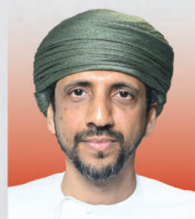
السيد إبراهيم بن سعيد البوسعيد وزير التراث والسياحة