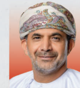
الدكتور سعود بن حمود الحبسي وزير الثروة الزراعية والسمكية وموارد المياه