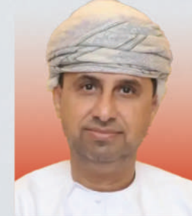
الدكتور عبدالله بن محمد بن سعيد السعيد وزير العدل والشؤون القانونية