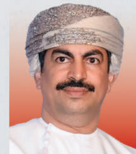
الدكتور عبدالله بن ناصر الحراصي وزير الإعلام