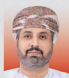
الدكتور محاد بن سعيد باعوين وزير العمل