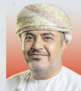
المهندس سعيد بن حمود المعولي وزير النقل والاتصالات وتقنية المعلومات