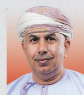
الدكتور هلال بن علي بن هلال السبتي وزير الصحة