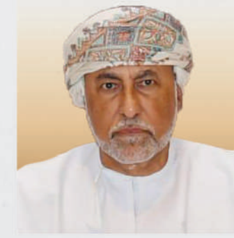
سمو السيد شهاب بن طارق بن تيمور آل سعيد نائب رئيس الوزراء لشؤون الدفاع