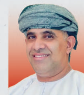
الدكتور خلفان بن سعيد الشعيلي وزير الإسكان والتخطيط العمراني