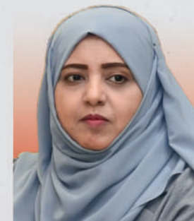
الدكتورة ليلى بنت أحمد النجار وزيرة التنمية الاجتماعية