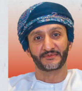
السيد سعود بن هلال بن حمد البوسعيد وزير الثقافة والرياضة والشباب