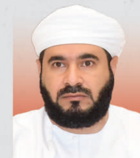
الدكتور محمد بن سعيد المعمر وزير الأوقاف والشؤون الدينية