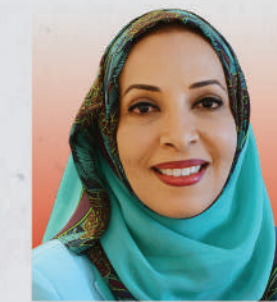
الدكتورة مديحة بنت أحمد الشيبانية وزيرة التعليم