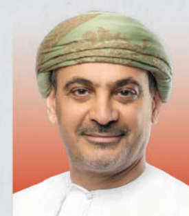
أنور بن هلال الجابري وزير التجارة والصناعة وترويج الاستثمار