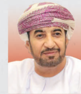
السيد خالد بن هلال بن سعود البوسعيد وزير ديوان البلاط السلطاني