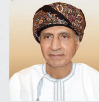
سمو السيد فهد بن محمود آل سعيد نائب رئيس الوزراء لشؤون مجلس الوزراء