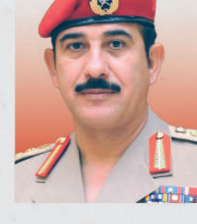
الفريق أول سلطان بن محمد النعماني وزير المكتب السلطاني