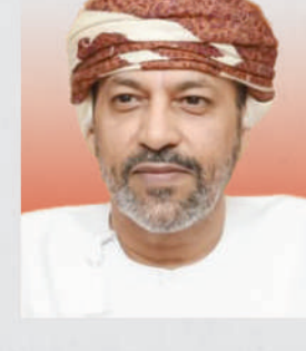
السيد حمود بن فيصل بن سعيد البوسعيد وزير الداخلية