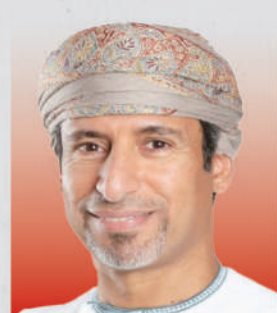
المهندس سالم بن ناصر بن سعيد العوفي وزير الطاقة والمعادن