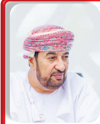
خالد بن هلال البوسعيدى

واستهل معاليه اللقاء بالترحيب بأعضاء المجلس، ثمّمًا العطاء الملموس والإنجازات التي تحققت خلال العام المنصرم. وأشاد معاليه بالإنجازات النوعية التي حققتها الأكاديمية على مختلف الأصعدة، مشيرًا إلى دورها المحوري في إحداث نقلة استراتيجية في المشهد الإداري والقيادي. وأكد أن ما حققته الأكاديمية من نجاحات متواصلة في تمكين القيادات الوطنية وتوطين المعارف الحديثة بالتعاون مع العديد من المؤسسات المحلية والعالمية الرائدة، يجسد الالتزام بالرؤية السامية لجلالة السلطان المعظم- حفظه الله و-رعا- في الاستثمار بالإنسان العُماني؛ باعتباره محركًا للتغيير وركيزة أساسية للجاهزية نحو المستقبل. وشهد الاجتماع استعراض إنجازات الأكاديمية لعام ٢٠٢٥؛ حيث قامت الأكاديمية السلطانية للإدارة بالتركيز على محاور عمل تكاملية تهدف إلى تطوير مجتمعات قيادية مؤثرة، بما يتوافق مع رؤية «عُمان ٢٠٤٠»، وأهم ما أنجز في هذا الشأن والذي يتمثل في البرامج والمبادرات والدراسات والجلسات والحوارات المنهجية؛ حيث عملت الأكاديمية على رفد الكفاءات الوطنية وفق منهج تكاملي وفلسفة تعلم ممنهجة، مبنية على أفضل