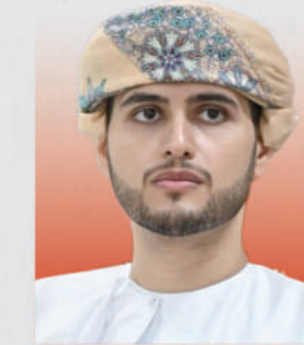
سمو السيد بلعرب بن هيثم بن طارق آل سعيد وزير الدولة ومحافظ مسقط