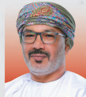
الدكتور خميس بن سيف الجابري وزير الاقتصاد