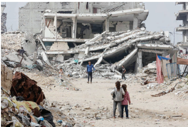
الرؤية- غرفة الأخبار

تواصل جهود كئائب القسام وبالتنسيق مع الصليب الأحمر لإسداء الستار على ملف تسليم جثث الأسرى الإسرائيليين، إذ تعمل الفرق على تكثيف البحث عن جثة آخر أسير في حي الزيتون بمدينة غزة وسط قطاع غزة.