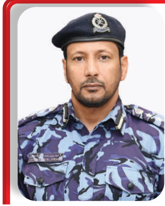
العقيد زايد الجنيبي

وقال العقيد زايد بن حمد الجنيبي رئيس المركز الوطني لإدارة الحالات الطارئة، إن التمرين يهدف إلى رفع جاهزية وكفاءة فرق الاستجابة، وتعزيز العمل المشترك بين مختلف الجهات المعنية بإدارة الحالات الطارئة، بما يحقق استجابة متكاملة وفعالة، ويسهم في حماية الأرواح والممتلكات العامة على المستوى الوطني. وأضاف أن التمرين يتضمن محاكاة عدد من الفرضيات للحالات الطارئة، تشمل