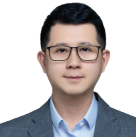
نشو شيوان **

وربط السوق الصينية بالأسواق العالمية بشكل أكثر سلاسة، وتحويل مناطق مثل هاينان إلى مختبرات للإصلاح والابتكار، وعلى مدى العقود الماضية، أنشأت الصين ٢٢ منطقة تجريبية للتجارة الحرة، وألغت القيود المفروضة على الاستثمار الأجنبي في قطاع التصنيع، ووسعت نطاق الوصول إلى الأسواق في قطاعات تشمل الاتصالات والرعاية الصحية والتعليم، ومع الاستمرار في هذا النهج فإن السنوات القادمة قد تشهد بروز مناطق تجارة حرة أكثر تطوراً، تؤدي دوراً محورياً في دفع الاقتصاد الصيني، وفي الوقت نفسه في دعم نمو الاقتصاد العالمي بشكل أكثر توازناً واستدامة. ** صحفي في مجموعة الصين للإعلام، متخصص بالشؤون الصينية وبفضايا الشرق الأوسط والعلاقات الصينية العربية