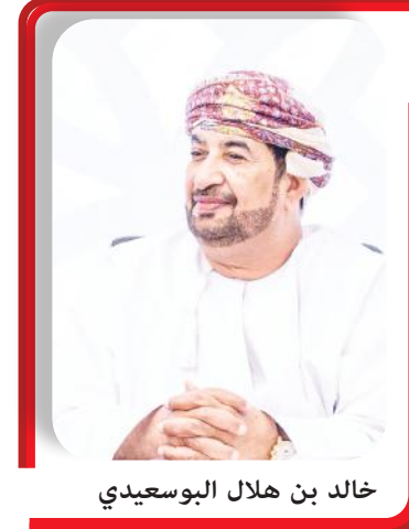
خالد بن هلال البوسعيدي

عقد مجلس أمناء الأكاديمية السلطانية للإدارة اجتماعه الرابع؛ برئاسة معالي السيد خالد بن هلال البوسعيدي وزير ديوان البلاط السلطاني رئيس مجلس الأمناء، وحضور أعضاء المجلس، وفي بداية الاجتماع، رخص معاليه بأعضاء المجلس، مشيداً بالجهود المبذولة من فرق العمل والقائمين على تنفيذ برامج ومبادرات ودراسات الأكاديمية. أكد معالي السيد خالد بن هلال البوسعيدي أن الأكاديمية السلطانية للإدارة تواصل منذ تأسيسها ترسيخ مكانتها كنموذج رائد في تعزيز الأداء الإداري والقيادي، مُستلهمة الرؤية السامية لفضرة صاحب الجلالة السلطان هيثم بن طارق المعظم - حفظه الله ورعاه - التي تولي أهمية كبيرة للاستثمار في الكفاءات الوطنية، مضيفاً أن الأكاديمية - ومن خلال شراكاتها المحلية والعالمية مع أبرز مؤسسات التعليم المرموقة وبرامجها ومبادراتها ودراساتها القائمة على الابتكار - تسعى إلى تمكين القيادات الوطنية بمعارف ومهارات عميقة لتعزيز جاهزية المستقبل والإسهام في تحقيق تطلعات رؤية «عُمان ٢٠٤٠».