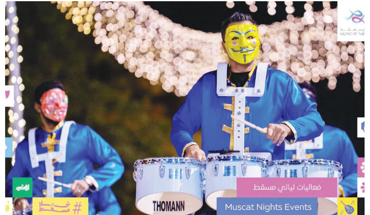
فعاليات ليالي مسقط