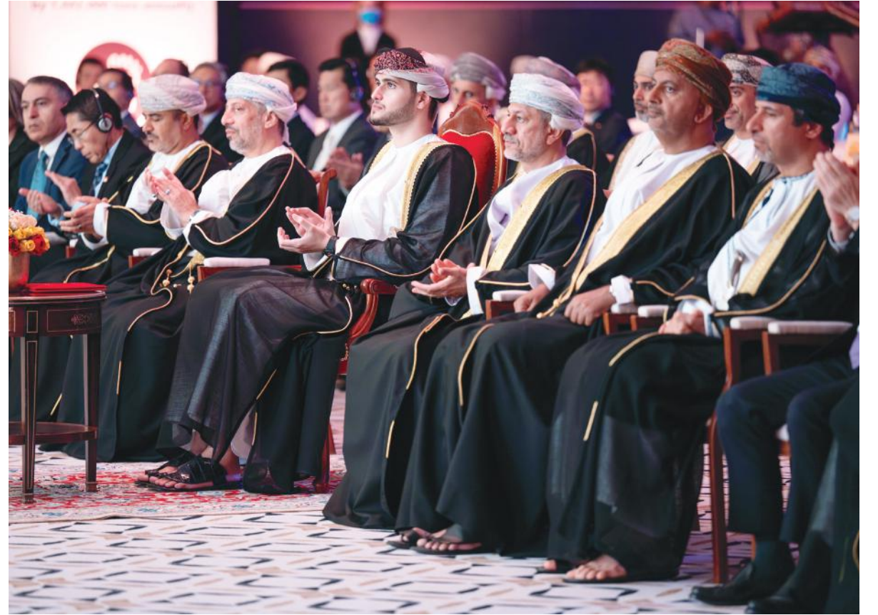
تصوير / راشد الكندي