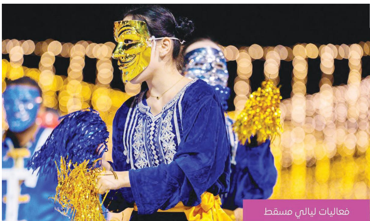
فعاليات ليالي مسقط