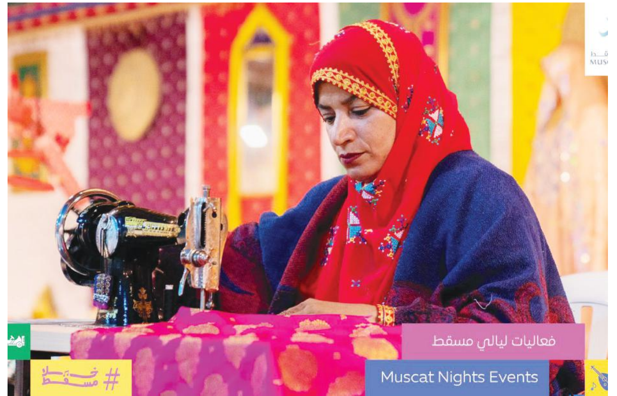
فعاليات ليالي مسقط