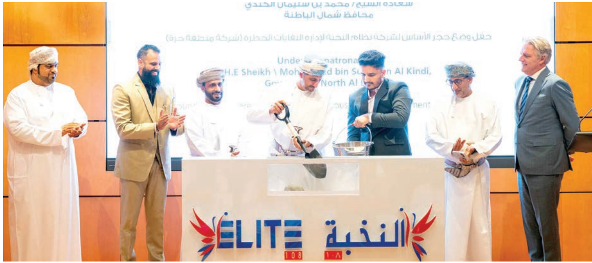
سعادة الشيخ / محمد بن سليمان الكندي محافظ شمال الباطنة

المشروع يعزز التزام «المنطقة الحرة بصحار» بتعزيز مكانتها كمركز رائد للحلول المبتكرة