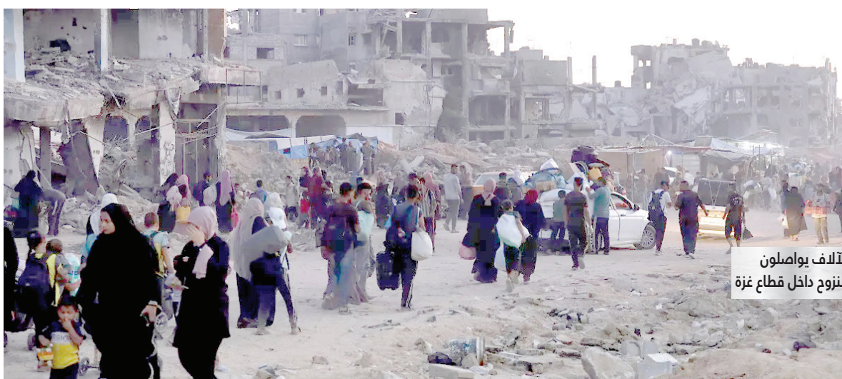
الآلاف يواصلون النزوح داخل قطاع غزة

أعلنت حركة المقاومة الإسلامية الفلسطينية «حماس» في بيان أمس الأربعاء نقلاً عن مصدر رسمي أنها تبادلت «بعض الأفكار» مع الوسطاء لوقف الحرب في قطاع غزة. وصرح المصدر المسؤول في الحركة «بتبادلنا بعض الأفكار مع الإخوة الوسطاء بهدف وقف العدوان على شعبنا الفلسطيني». فيما قال جهاز المخابرات الإسرائيلي «الموساد» في بيان إن إسرائيل تدرس رد حركة «حماس» على اقتراح يتضمن اتفاقاً على إطلاق سراح الأسرى ووقف إطلاق النار في قطاع غزة. وجاء في بيان أصدره مكتب رئيس الوزراء بنيامين