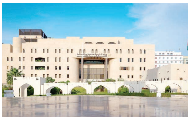
مسقط - الرؤية

أعلنت وزارة التجارة والصناعة وترويج الاستثمار بالتعاون مع هيئة حماية المستهلك عن تنظيم عمل التخفيضات والعروض الترويجية، بحيث يسمح لجميع المنشآت التجارية بعمل التخفيضات والعروض الترويجية لكافة المنتجات دون الحاجة للحصول على تصريح من الوزارة.