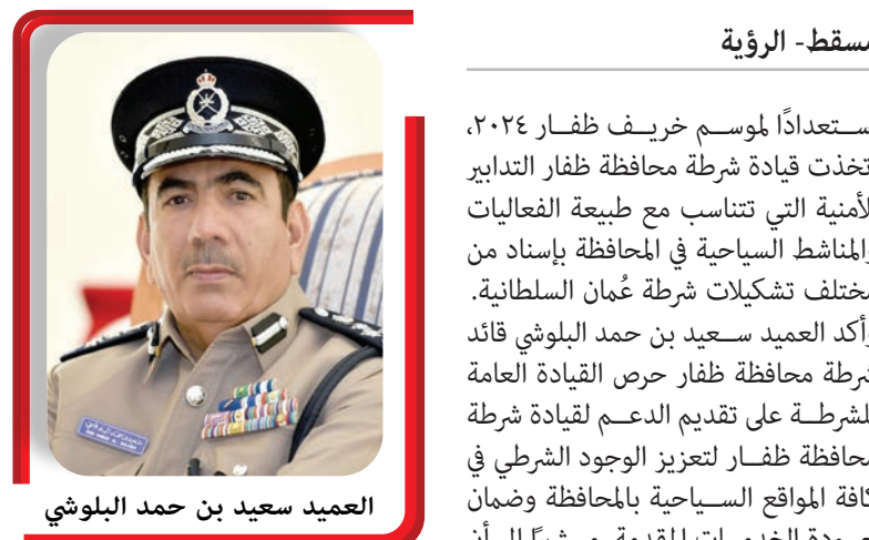
مسقط - الرؤية

استعداداً لموسم خريف ظفار ٢٠٢٤، اتخذت قيادة شرطة محافظة ظفار التدابير الأمنية التي تتناسب مع طبيعة الفعاليات والمناسبات السياحية في المحافظة بإسناد من مختلف تشكيلات شرطة عُمان السلطانية. وأكد العميد سعيد بن حمد البلوشي قائد شرطة محافظة ظفار حرص القيادة العامة للشرطة على تقديم الدعم لقيادة شرطة محافظة ظفار لتعزيز الوجود الشرطي في كافة المواقع السياحية بالمحافظة وضمان جودة الخدمات المقدمة، مشيراً إلى أن اللجان المختصة بشرطة عُمان السلطانية عقدت عدة اجتماعات وقامت بزيارات ميدانية للوقوف على كافة الاحتياجات والمتطلبات من إجراءات أمنية ومرورية في المواقع السياحية. وأفاد العميد قائد شرطة محافظة ظفار بأن هناك تدابير خاصة تم اتخاذها للتعامل مع الزيادة المتوقعة في أعداد السياح خلال