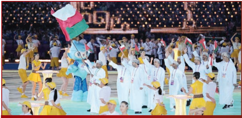
عمان مستعدة لاستحقاق «أولمبياد باريس 2024» 11

« ترقب دولي للرد اليمني على «هجوم الحديدة».. و«أنصار الله»: حربنا بلا حدود