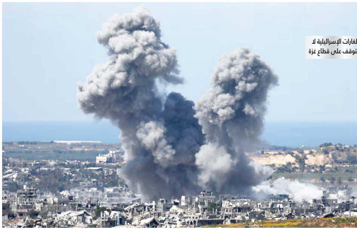
الغارات الإسرائيلية لا تتوقف على قطاع غزة

توعدت إيران أمس الثلاثاء بالانتقام من إسرائيل بسبب هجوم جوي أسفر عن مقتل اثنين من كبار القادة العسكريين وخمسة مستشارين عسكريين آخرين في مجمع السفارة الإيرانية في دمشق، مما يسلط الضوء على خطر المزيد من التصعيد بعد الهجوم غير المسبوق.