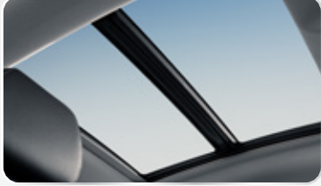
فتحة سقف بانورامية