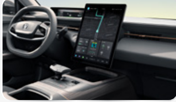
شاشة وسطية ١٣.٢ LCD بوصة