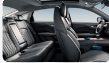
مقاعد بتصميم رياضي