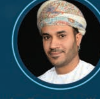
عبدالله بن حمود البرواني مدير عام أمن المعلومات والشبكات (عماني)