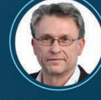
البروفيسور مارتين ستيرل رئيس وحدة الكفاءة في تقنيات الأمن والاتصالات بالمعهد النمساوي للتكنولوجيا (AIT)