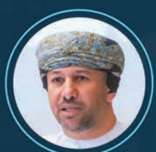
م. بدر بن علي الصالحي مدير عام المركز الوطني للأمن الإلكتروني