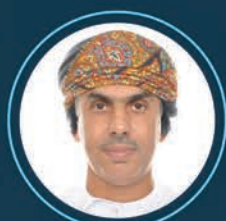
الدكتور مازن بن حمد الشعيبي مساعد رئيس مركز الدفاع الإلكتروني