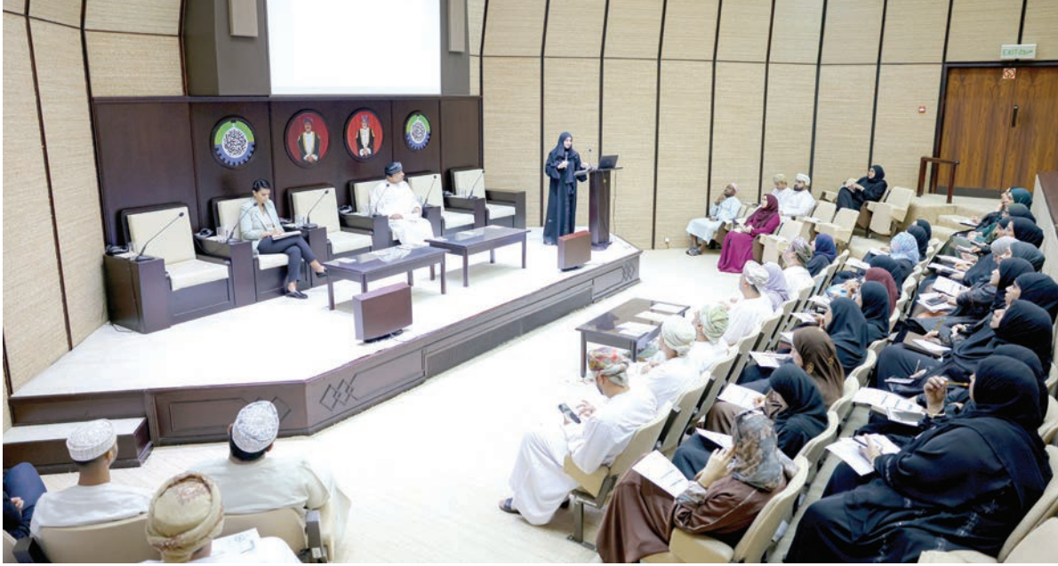
مسقط - الرؤية

استعرضت ندوة «تمويل المؤسسات الصغيرة والمتوسطة.. الفرص والتحديات»، والتي نظمتها غرفة تجارة وصناعة عمان ومؤسسة المرأة العربية للخدمات الإعلامية، سبل تمكين المؤسسات الصغيرة والمتوسطة وتذليل الصعوبات التي تواجهها من أجل زيادة مساهمتها في الاقتصاد الوطني، بما يتماشى مع رؤية عمان ٢٠٤٠.