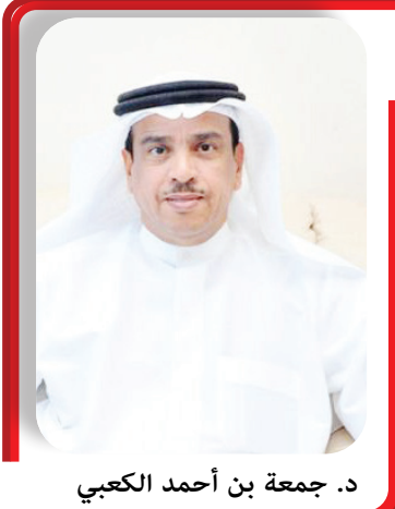
د. جمعة بن أحمد الكعبي

ورفع سعادة السفير الدكتور، أسمى آيات التهاني والتبريكات إلى جلالة الملك حمد بن عيسى آل خليفة ملك البحرين، وإلى صاحب السمو الملكي الأمير سلمان بن حمد آل خليفة ولي العهد رئيس مجلس الوزراء، وإلى شعب البحرين الوفي، بمناسبة حلول الذكرى السنوية الثانية والعشرين للتصويت على ميثاق العمل الوطني، الذي يمثل انطلاقة عهد جديد من الإصلاحات الدستورية والتشريعية، والتي تميزت بالإنجازات التنموية والنجاحات الكبيرة التي حققتها مملكة البحرين، ضمن مسيرة النهضة الشاملة والتقدم والازدهار على كافة الأصعدة وفي مختلف المجالات في ظل