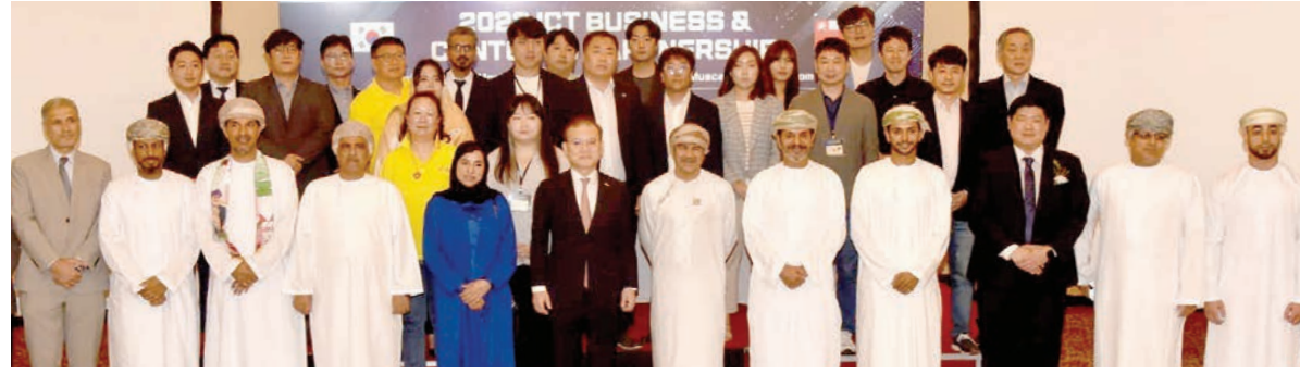
مسقط - الرؤية

عقدت أمس سلسلة اجتماعات شراكة "بي تو بي"، بين الشركات العمانية الصغيرة والمتوسطة ونظيراتها الكورية، العاملة في مجال تكنولوجيا المعلومات والاتصالات وقطاع تطوير المحتوى، بحضور سعادة حليلة بنت راشد الزرعيبة رئيسة هيئة تنمية المؤسسات الصغيرة والمتوسطة، وسعادة كيم كيجو سفير جمهورية كوريا المعتمد لدى سلطنة عُمان.