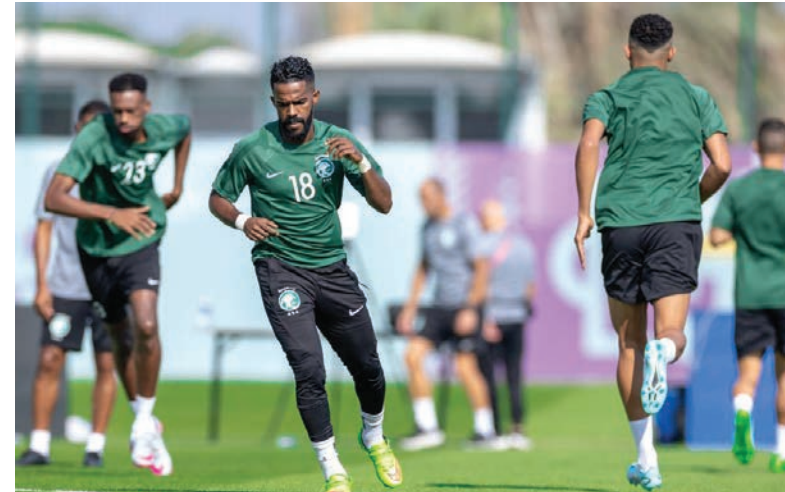
تدريبات مكثفة لـ«الأخضر» استعدادًا لمواجهة «التانجو»

لذا فجهوده مع زملائه المدافعين عن ألوان بلاد الفضة ستتضاعف من أجل إنهاء المسيرة باللقب الوحيد الذي ينشده الغرغوث الأرجنتيني الذي لا يتوقف عن اللدغ. وفاز ميسي خلال مسيرة رائعة بجميع الألقاب الممكنة بقميص برشلونة الإسباني ثم باريس سان جرمان الفرنسي، كما توج مع بلاده بكوبا أمريكا عام ٢٠٢١ ليقودها إلى أول لقب قاري منذ ١٩٩٣. ويشارك ميسي (٣٥ عامًا) في النسخة الخامسة من الموندリアル، إلا أن أفضل مستوياته قدمها في نسخة البرازيل ٢٠١٤، عندما قاد منتخب بلاده نحو وصافة البطولة.