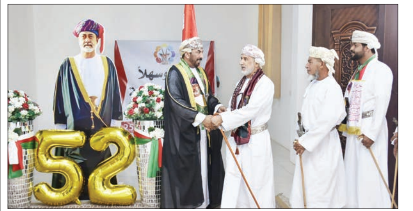
مسقط - الرؤية

وبدأ الحفل باستقبال المدعوين؛ حيث كان في استقبالهم سعادة الشيخ والي بهلا ونائبه وأصحاب السعادة أعضاء مجلس الشورى ممثلو الولاية. وتبادل سعادته والحضور التهاني والتبريكات بهذه المناسبة الوطنية، داعياً المولى القدير أن يديم الصحة والعافية على جلالة سلطان البلاد المفدى، وأن يحفظ جلالته قائداً لعمان الخير نحو مزيد من