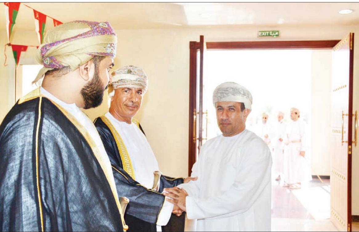
بهلا - ناصر العبري

أقام سعادة الشيخ علي بن منصور بن ناصر البوسعيدي والي بهلا حفل استقبال ابتهاجاً بالعيد الوطني الثاني والخمسين المجيد، تحت القيادة الحكيمة لحضرة صاحب الجلالة السلطان هيثم بن طارق المعظم - حفظه الله ورعاه. وأقيم الاحتفال بالقاعة المتعددة الأغراض التابعة لوزارة الداخلية بمكتب الوالي بحضور عدد من أصحاب السعادة أعضاء مجلس الشورى وعدد من المكرمين أعضاء مجلس الدولة والشيخ إبراهيم بن سعيد بن ناصر الهدابي نائب والي بهلا، والشيخ والرشداً والأعيان وعدد من مديري العموم ومديري الدوائر الحكومية والأهلية وجمع من المواطنين.