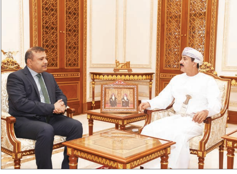
مسقط - النعماني

وسلطنة عُمان أثناء تأدية عملها، متمنياً لها دوام التوفيق. كما استقبل معالي الفريق أول سلطان بن محمد النعماني وزير المكتب السلطاني أمس سعادة الدكتور خالد بن صالح بن شريف سفير الجمهورية اليمنية المعتمدة لدى سلطنة عُمان. وشهدت المُقابلة تبادل الأحاديث الودية حول عددٍ من مجالات التعاون المشتركة للبلدين الشقيقين، والتطرق إلى عددٍ من الأمور ذات الاهتمام المشترك وسبل تطويرها. من جانبه أثنى سعادة السفير على جهود سلطنة عُمان في مساعي حل الأزمة اليمنية ودعمها لتحقيق السلام بالتنسيق مع كافة الأطراف الدولية ذات العلاقة.