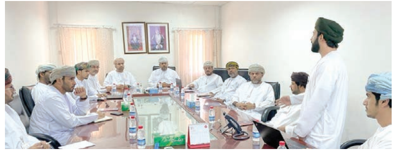
مسقط - الرؤية

ومن شأن هذه الزيارات أن تسهم في إعداد وتحديث السياسات العامة للفصح والرقابة والالتزام وكذلك إعداد نماذج موحدة لجمع المعلومات والبيانات الخاصة بالالتزام والرقابة البيئية في جميع المجالات وفتح قنوات اتصال وتسهيل الإجراءات وخلق بيئة جاذبة للاستثمار. وتضمن برنامج الزيارات تقديم مبريات عن دور قطاع الالتزام والتشريعات لتوضيح معايير الالتزام والشؤون البيئية وتعزيز الشراكة مع الشركات المشغلة في المناطق الاقتصادية والحرّة بما يخدم تحقيق الأهداف الأساسية للهيئة.