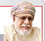
مؤشرات تدعو إلى القلق