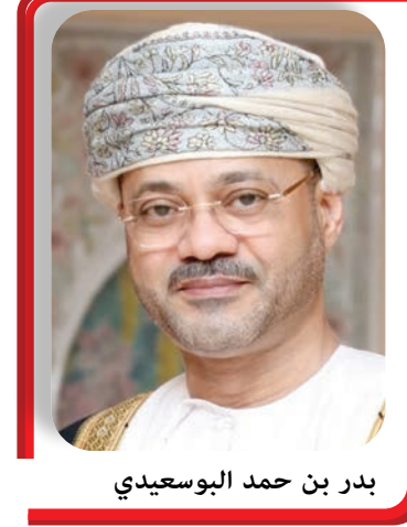
بدر بن حمد البوسعيدي

أجرى معالي السيد بدر بن حمد البوسعيدي وزير الخارجية اتصالاً هاتفيًا مع معالي ديمترو كوليبا وزير خارجية أوكرانيا يتصل بالأزمة الأوكرانية والتأكيد على أهمية الدبلوماسية والاحتكام إلى الحوار والمفاوضات السلمية بين أطراف الأزمة على أساس ميثاق الأمم المتحدة والقانون الدولي ومبدأ حسن الجوار. كما تم التطرق إلى علاقات الصداقة القائمة بين البلدين والحرص المتبادل على تنميتها.