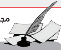
مجالس بلدية ونهضة متجددة