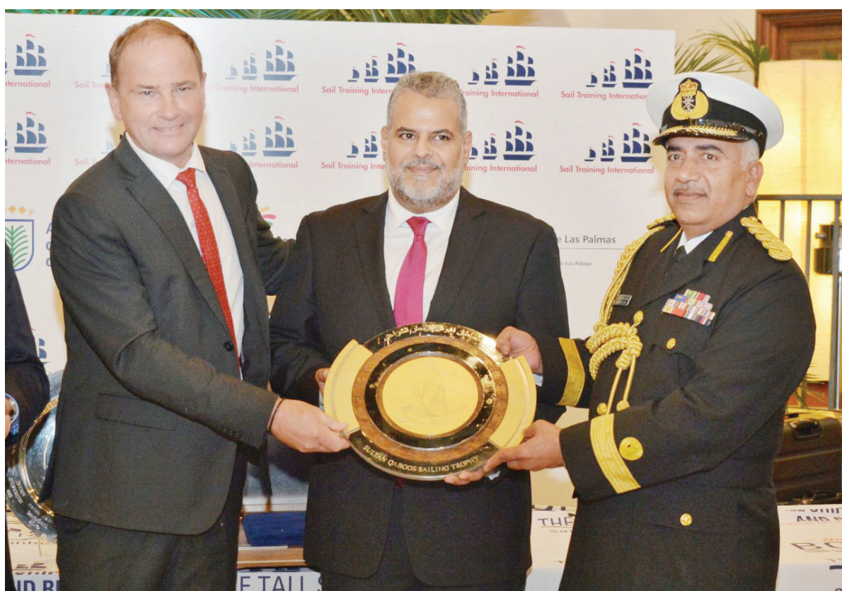
مدير - العمانية

احتفلت وزارة الدفاع ممثلة بالبحرية السلطانية العمانية في جزيرة الكناريا الكبرى بمملكة إسبانيا، بتسليم جائزة السلطان قابوس للإبحار الشراعي في نسختها العاشرة لهذا العام للسفينة النرويجية كريستيان راديك، تزامناً مع احتفالات سلطنة عُمان بالعيد الوطني الثاني والخمسين المجيد. وقد فازت السفينة النرويجية بالجائزة نظراً لتاريخها الحافل بالإنجازات في مجال التدريب على الإبحار الشراعي. رعى حفل تسليم الجائزة سعادة السفير عمر بن سعيد الكعبي، سفير سلطنة عُمان لدى مملكة إسبانيا، بحضور العميد الركن بحري طارق بن عيسى الرئيسي كبير ضباط الأركان بقيادة البحرية السلطانية العمانية، وعدد من منسوبي البحرية السلطانية العمانية، ومسؤولين من جزيرة الكناريا الكبرى بمملكة إسبانيا، وجمع من المهتمين بالتدريب على الإبحار الشراعي. وقد تنافس على الجائزة لهذا العام عدد من المؤسسات البحرية الحكومية والخاصة الدولية إلى جانب عدد من المهتمين بالإبحار الشراعي العالمي، وتم اختيار الفائز بالجائزة خلال المؤتمر السنوي للجمعية الدولية للتدريب على الإبحار الشراعي، إضافة إلى مناقشة مختلف المستجدات في مجال التدريب على الإبحار الشراعي على مستوى دول العالم واستعراض الدروس المستفادة من المناسبات التي تنظمها الجمعية. وتعد جائزة السلطان قابوس للإبحار الشراعي من أرقى الجوائز التي تمنح في مجال الإبحار الشراعي، وتعمل على تعزيز التدريب على الإبحار الشراعي على مستوى العالم وتمنح لأفضل المؤسسات أو السفن أو الأفراد لما