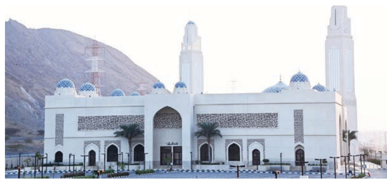
مسقط - العمانية

الرئيسة للرجال لتسع لـ ١٧٤٠ مصلياً وقاعة صلاة للنساء لتسع لـ ٨٨٢ مصلية، وقاعة متعددة الأغراض من طابقين، وسكن للأئمة والمستخدمين ومخازن. وتم تزويد الجامع بأنظمة حديثة للصوت والمراقبة ونظم المعلومات.