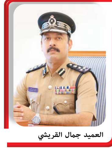
العميد جمال القرشي

تشكل جريمة تداول العملات الرقمية الوهمية والترويج لها إحدى الظواهر الجرمية الحديثة التي انتشرت في الفترة الأخيرة، نتيجة التطور في تقنية المعلومات ووسائل الدفع الإلكتروني، لذلك تعددت الأساليب للإيقاع بالضحايا ودفعهم نحو التداول بالعملات عبر منصات وهمية تدار من خارج سلطة عمان بهدف الاستيلاء على أموالهم. وقال العميد جمال بن حبيب القرشي مدير عام التحريات والبحث الجنائي، إن عملية تداول وتخزين العملات الرقمية الوهمية إلكترونياً وفق آلية تشفير محددة غير موجودة في الواقع بل تدار عبر شبكات مجهولة الهوية، مؤكداً انتشار جرائم الاحتيال بشكل كبير على المستوى المحلي خلال العام الجاري مقارنة بالسنوات الماضية، مما يستوجب