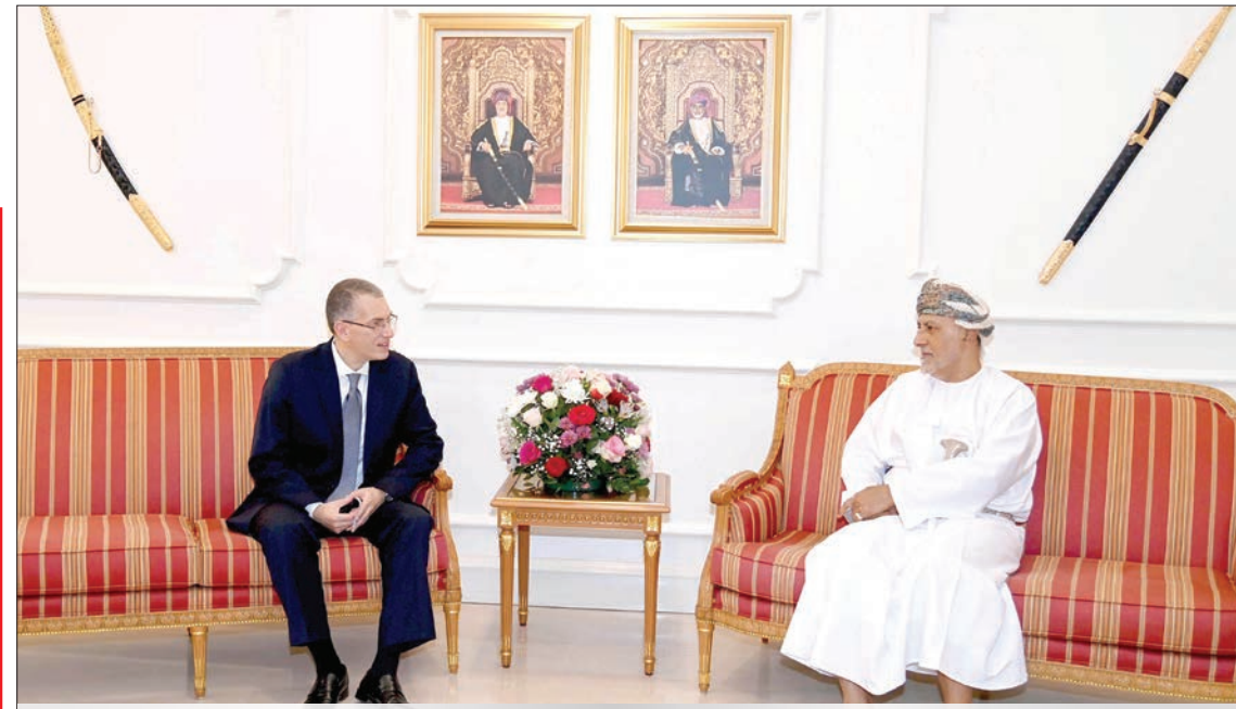
السيد شهاب يستعرض مع السفير المصري العلاقات القائمة 02

السفير المصري لـ«الرؤية»: الزيارة التاريخية للرئيس السيسي تجسّد عمق العلاقات الزيارة تشهد توقيع عدد من الاتفاقيات ومذكرات التفاهم مشاورات سياسية حول مستجدات القضايا الإقليمية والدولية