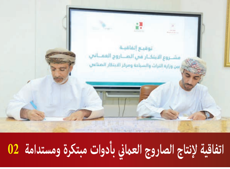
اتفاقية لإنتاج الصاروخ العمالي بأدوات مبتكرة ومستدامة 02

يومية شاملة تصدر عن مؤسسة الرؤية للصحافة والنشر