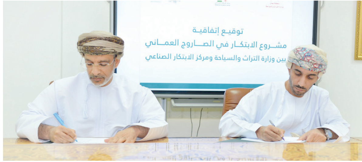
توقيع اتفاقية مشروع الابتكار في الصاروج العماني بين وزارة التراث والسياحة ومركز الابتكار الصناعي

وسيمت العمل بالمشروع مباشرة بعد توقيع الاتفاقية وفق منهجية واضحة تتولاها اللجنة الفنية، وتتضمن ثلاثة مراحل رئيسية: تبدأ باستكشاف فرص تطوير صناعة الصاروج في السلطنة؛ حيث سيتم استكشاف الفرص لتطوير صناعة الصاروج العماني، مع التركيز على جمع وتلخيص المعلومات بشأن الصناعة الحالية من خلال إجراء المقابلات مع المعنيين في هذا القطاع في السلطنة، وإيجاد الحقائق الموجزة،