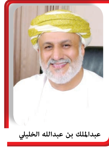
عبدالمك بن عبدالله الخليلي

جلالتكم وفُتتم بفضل الله في التصدي لكل تلك المؤثرات بما رسمتموه لحكومتمكم من سياسة استقبلت الوقائع بتأمل عميق، وفكر هادئ استبطن كوامنها، ووضع لها الحلول التي أثمرت أماناً ورفاهاً وتحقق به لشعبكم المستوى الكريم من الأمن النفسي والمعيشي والصحي. وبما باشرتموه قبل ذلك من إصلاحات شملت العديد من الوحدات الحكومية، وهيكله المرافق الاقتصادية لتعزيز الموارد الوطنية، واعتماد خطة التوازن المالي، وما صاحب ذلك من تشريعات قانونية، كلها عظمة بدأت مؤشرات نتائجها الإيجابية تظهر في قدرة السلطنة على التغلب التدريجي على التحديات الصعبة التي أفرزتها المتغيرات العالمية. وإنما إذ نتقدم لجلالتكم بالتهنئة بهذه الذكرى التاريخية المجيدة، فإننا نجدد العهد لجلالتكم بأن نمضي خلف قيادتكم بالسمع والطاعة لأمركم، ضارعين إلى الله العليّ القدير أن يجعلكم في معيته في كل شأن من شؤونكم، تؤيدكم عنايته، ويحفظكم توفيقه وتسديده. وكل عام وجلالتكم بخير.