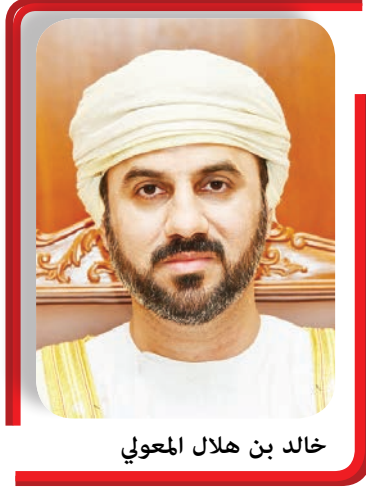
خالد بن هلال المعوي

تسير نحو آفاق المجد والسمو، نحو رؤية عمانيّة تعد بالخير للوطن والإنسان، وتبشّر بمستقبل مشرق لأبناء عُمان البررة الأوفياء. مولاي صاحب الجلالة - حفظكم الله.. في هذا اليوم الأغرّ البيهج نجدد العهد والولاء للسير خلف قيادتكم سير المخلصين الباذلين والمجاهدين العاملين هذه المناسبة الوطنية المحيية على وطاعة لجلالتكم، سائلين المولى جلّ في علاه أن يُكفل مساعي وجهود جلالتمكم المخلصة إلى تحقيق غايات وآفاق عُمان المنشودة. والله تعالى نسأله أن يحفظكم ويرعاكم ويهدم بنصره وعونه وتأييده ويكلامكم موفور الصحة والعافية والعمر المديد، ويُعيد هذه المناسبة الوطنية المحيية على جلالتمكم وأنتم في خير وسعادة ويُمن وهناء وعُمان في عزّة ومنعة ورفعة وأبناؤها الكرام في أمن وأمان. وكلّ عام وجلالتكم بخير.. والسلام عليكم ورحمة الله وبركاته.